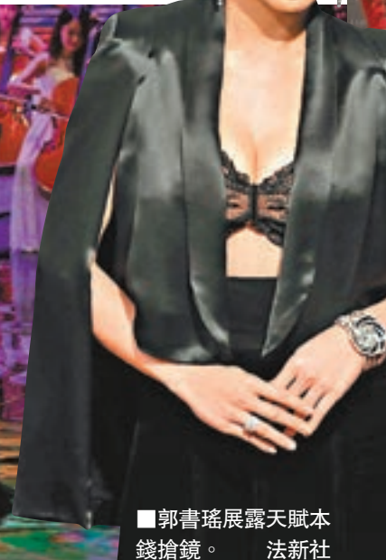
郭書瑤展露天賦本錢搶鏡。