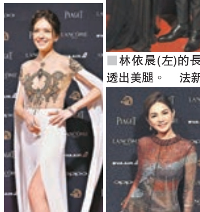
林依晨（左）的長裙透出美腿。