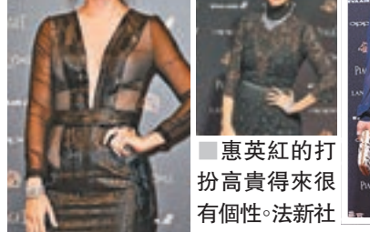
惠英紅的打扮高貴得來很有個性。