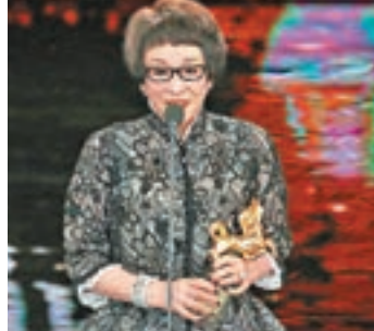
「永遠的俠女」徐楓獲頒終身成就獎，她笑言此獎一生只能得一次。