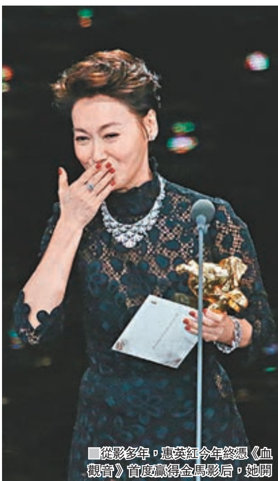
從影多年，惠英紅今年終憑《血觀音》首度贏得金馬影后，她開心得大送飛吻。