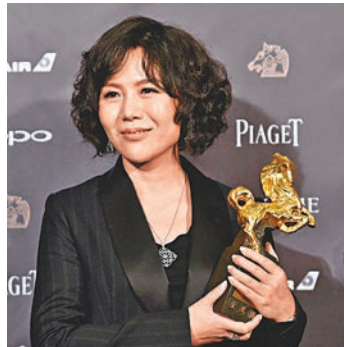
內地女導演文晏憑《嘉年華》摘下最佳導演。