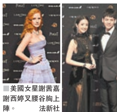
美國女星謝茜嘉謝西婷又腰谷胸上陣。