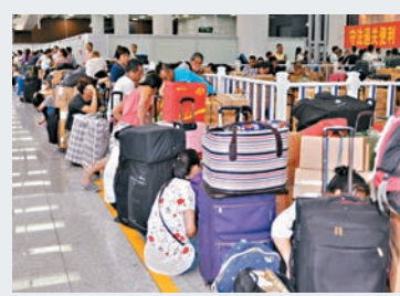
不少「水貨客」表示打算改帶奶粉和尿片以外的消費品。