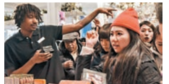
美國購物節「黑色星期五」期間，消費者在紐約梅西百貨選購心水貨品。

香港文匯報訊(記者孔雯瓊 上海報道)「雙十一」購物狂歡節剛過，內地消費者又瞄準了11月24日開始的美國購物節「黑色星期五」。據去哪兒網聯合美國佛羅里達州旅遊局共同發佈的大數據報告顯示，今年「黑五」期間內地遊客赴美人數激增69.5%，人數激增的主因是國民收入增加、機票降價。今年平均含稅機票價格比去年減少了495元(人民幣，下同)，僅為3,078.7元。