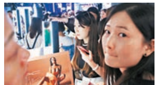
年輕內地消費者在本港購買化妝品。資料圖片

香港文匯報訊 全球管理諮詢公司麥肯錫23日發佈的一份報告顯示，「90後」中國年輕人正成為中國消費市場的新引擎。