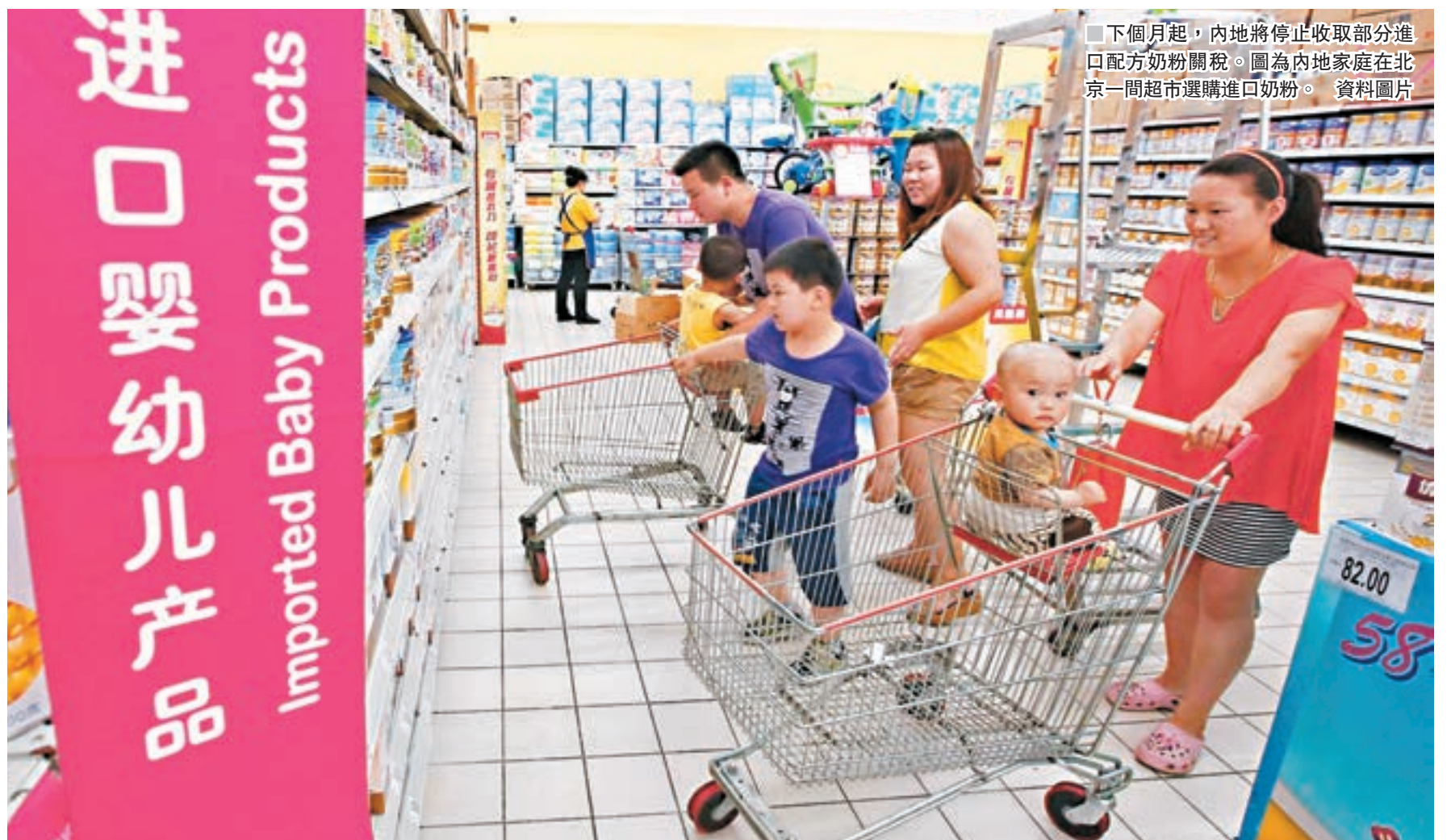
下個月起，內地將停止收取部分進口配方奶粉關稅。圖為內地家庭在北京一間超市選購進口奶粉。