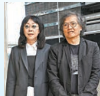
導演羅啟銳、張婉婷夫婦昨日到場致哀。

昨早未到9時圈中好友已經陸續到靈堂送別陳自強，計有狄龍與太太陶敏明、狄波拉與老公鬚鬚Kong、商天娥、李寶安、施南生、陳法蓉、蔡少芬及張晉等；至於成龍穿黑西裝架墨鏡於9時05分抵達，他一如前晚設靈時走後樓梯往靈堂上去，面對傳媒仍略帶笑容，陸續有謝賢、楊受成、林家棟、梁乃鵬及林小明前來送別。