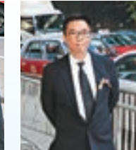
導演關錦鵬與陳自強交情甚深。