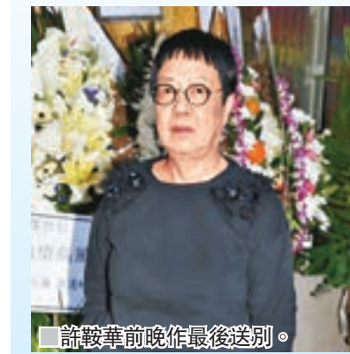
詠幹前晚作最後送別。