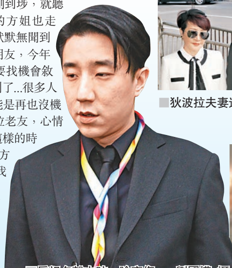
房祖名離去時一臉哀傷。