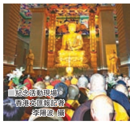
紀念活動現場。

國家宗教局副局長蔣堅永在發言時指出，佛指舍利重光實現了當代中國佛教走向世界和中華文化復興的殊勝因緣。希望中國佛教協會、陝西佛教協會和法門寺以此活動為契機，進一步加強對外友好交流，以及與港澳台佛教界的交流、交往與合作，服務國家「一帶一路」，促進沿線國家之間的交流互鑒和民心相通。