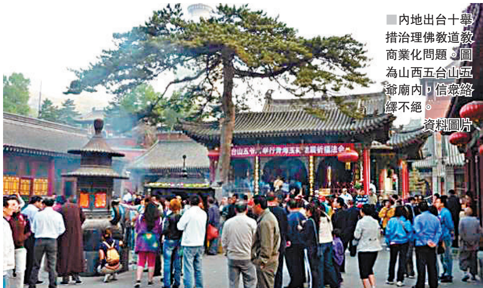
■ 內地出十舉措治理佛教道教商業化問題。圖為山西五台山五爺廟內，信眾絡繹不絕。資料圖片

對於近年興起的「網上燒香禮佛」，意見明確規定，非宗教活動場所、非宗教團體、非宗教院校和個人設立的互聯網宗教信息平台不得組織宗教活動，不得開展「網上燒香」、「網上禮佛敬佛」、網上功德箱募款和售賣佛教道教衍生商品等活動，不得接受宗教性捐贈。宗教活動場所、宗教團體、宗教院校設立的互聯網宗教信息平台接受宗教性捐贈，應當遵守相關規定。