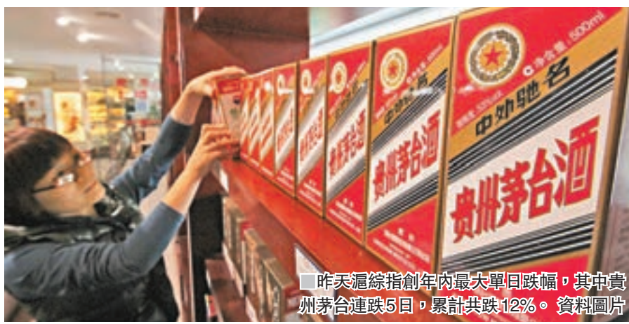
昨天滬綜指創年內最大單日跌幅,其中貴州茅台連跌5日,累計共跌12%。資料圖片

但巨豐投顧同時提到,在指數下跌之際,滬股通資金持續流入,表明外資對A股的關注度依舊較高。值得注意的是,昨日滬股通淨流入20.99億元,創今年10月10日以來最大淨流入。巨豐投顧認為,在基本面支撐下,大盤總體上行趨勢仍未改變。