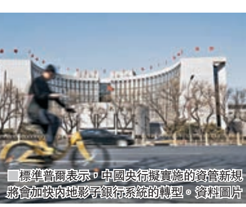
標準普爾表示,中國央行擬實施的資管新規將會加快內地影子銀行系統的轉型。

型」產品的意願就會降低。如果風險更為明晰,擔保不復存在,客戶投資預期收益型理財產品的積極性也會降低。而這類產品正是內地影子銀行市場的主流。標普指,如果新規定以實行,隨着銀行停發理財產品並將基礎資產從表外移至表內,其報告資本比率將承受壓力。但預計這一點不會使受評中資銀行的信用地位承壓,因為這些銀行在最低監管資本要求之外還有充足的資本緩衝。