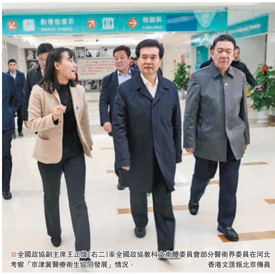
全國政協副主席王正偉(右二)率全國政協教科文衛體委員會部分醫衛界委員在河北考察「京津冀醫療衛生協同發展」情況。

他希望天津市立足實際，發揮優勢，彰顯特色，補齊短板，加強頂層設計，全力提升自身綜合實力，不斷擴大綜合輻射能力，加大承接北京非首都功能疏解的力度，支持河北醫療衛生事業發展，最大限度地提升三地百姓看病就醫便利性，全方位助推京津冀醫療衛生錯位發展、融合發展、協同發展。