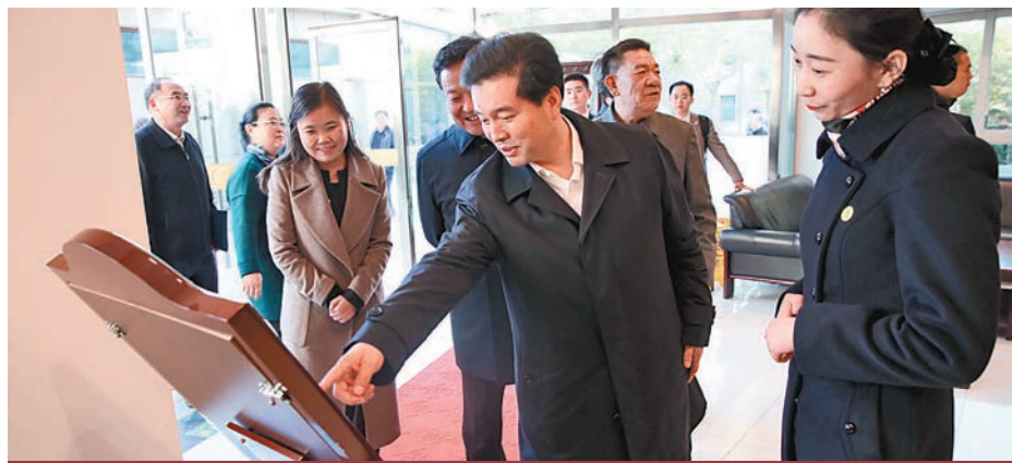
王正偉(右二)在河北廊坊考察「京津冀醫療衛生協同發展」。香港文匯報北京傳真

保直接結算意義重大，使廣大河北人民和居住在燕郊的40萬京籍人員，在家門口就能享受到北京大醫院優質醫療服務，並為京籍老人在燕達養老中心就醫提供了可靠保障。同時，有效緩解了北京就醫壓力、養老服務緊缺、交通擁堵、環境污染、資源消耗等一系列社會問題，「這是京津冀協同發展、疏解非首都功能、惠及百姓取得的重大成果之一」。