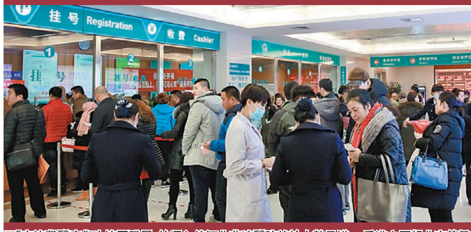
「京津冀醫療衛生協同發展」的深入使河北燕達醫院就診人數倍增。