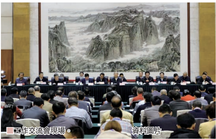
工作交流會現場。

香港文匯報·人民政協專刊訊 11月16日，全國暨地方政協民族和宗教委員會工作交流會在貴州貴陽召開。全國政協副主席馬飈出席會議並講話。