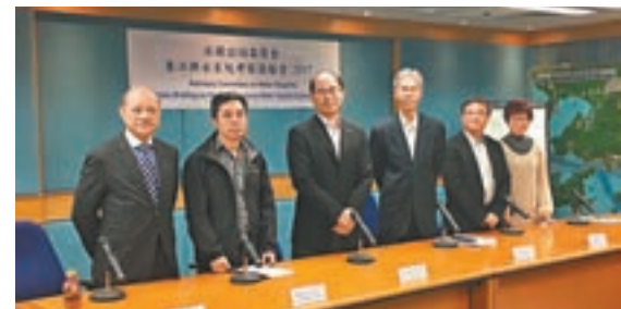
水諮會指東江水水質有改善。