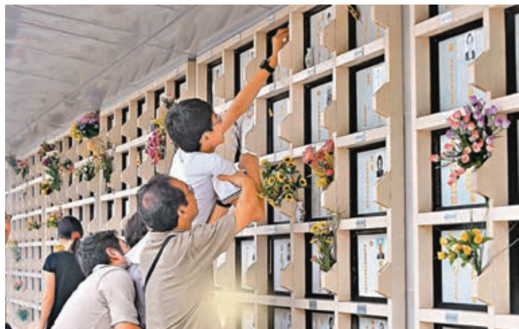
政府在發牌委員會開始接受牌照申請前放寬發牌條件，所有在2014年6月18日前已經營辦、並合乎申請牌照資格的骨灰安置所都可以免補地價。

不過，在今年6月30日後才出售的龕位則不受新措施影響，骨灰安置所經營者除了要提交管理方案予發牌委員會外，亦需向城規會提交交通影響評估才能申請改劃。