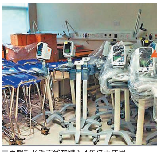
■ 血壓計及洗衣袋架購入4年仍未使用。