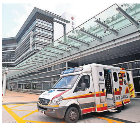
■ 北大嶼山醫院被審計署批評無善用資源。資料圖片