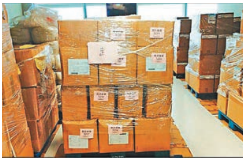
■ 空置病房用作貯物。