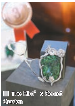
The Bird's Secret Garden

另一邊廂，在香港會展則舉辦了「國際時尚翡翠首飾設計大賽」，並由著名模特兒周汶錡即席試戴各組別的得獎作品，例如試戴了「零售價一萬美元以下成品公開組」冠軍作品《森林中的王子》、亞軍作品《大嘴鳥》及季軍作品《Blossom》，以及「零售價一萬美元以上成品公開組」冠軍作品《時間之旅》、亞軍作品《春色》及季軍作品《The Bird's Secret Garden》，設計創新，從中推廣翡翠首飾設計現代化。