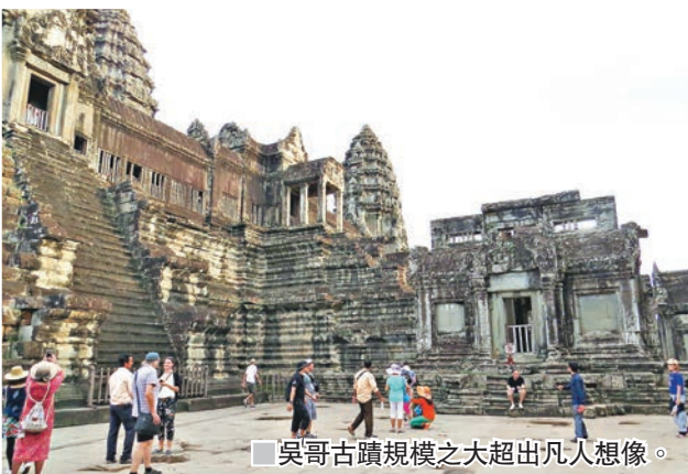
吳哥古蹟規模之大超出凡人想像。