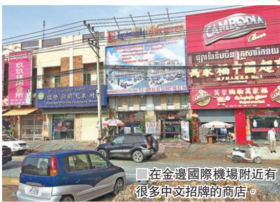
在金邊國際機場附近有很多中文招牌的商店。

柬埔寨近年內地遊客的增長十分迅猛，成為該國最大的國際旅客來源地，旅遊大臣童坤上月底表示，今年前8個月，柬埔寨接待國際遊客約350萬人次，同比增長11.8%；其中接待內地遊客74萬多人次，同比增長44%。他預計今年柬埔寨將接待內地遊客至少100萬人次，這個數字到2020年將翻番到200萬。