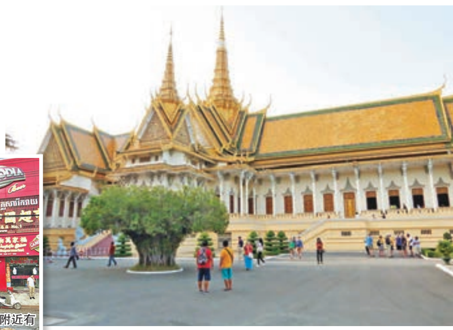
柬埔寨金邊王宮是當地另一旅遊勝地。