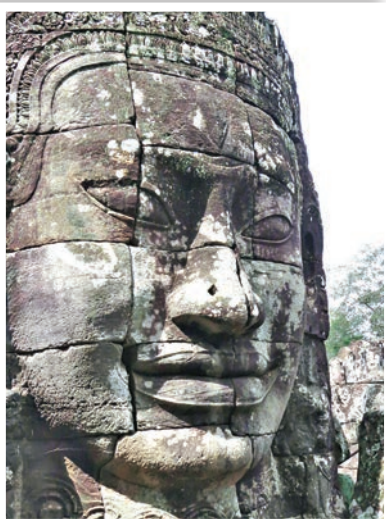
「高棉微笑」。巨型佛像帶着神秘的