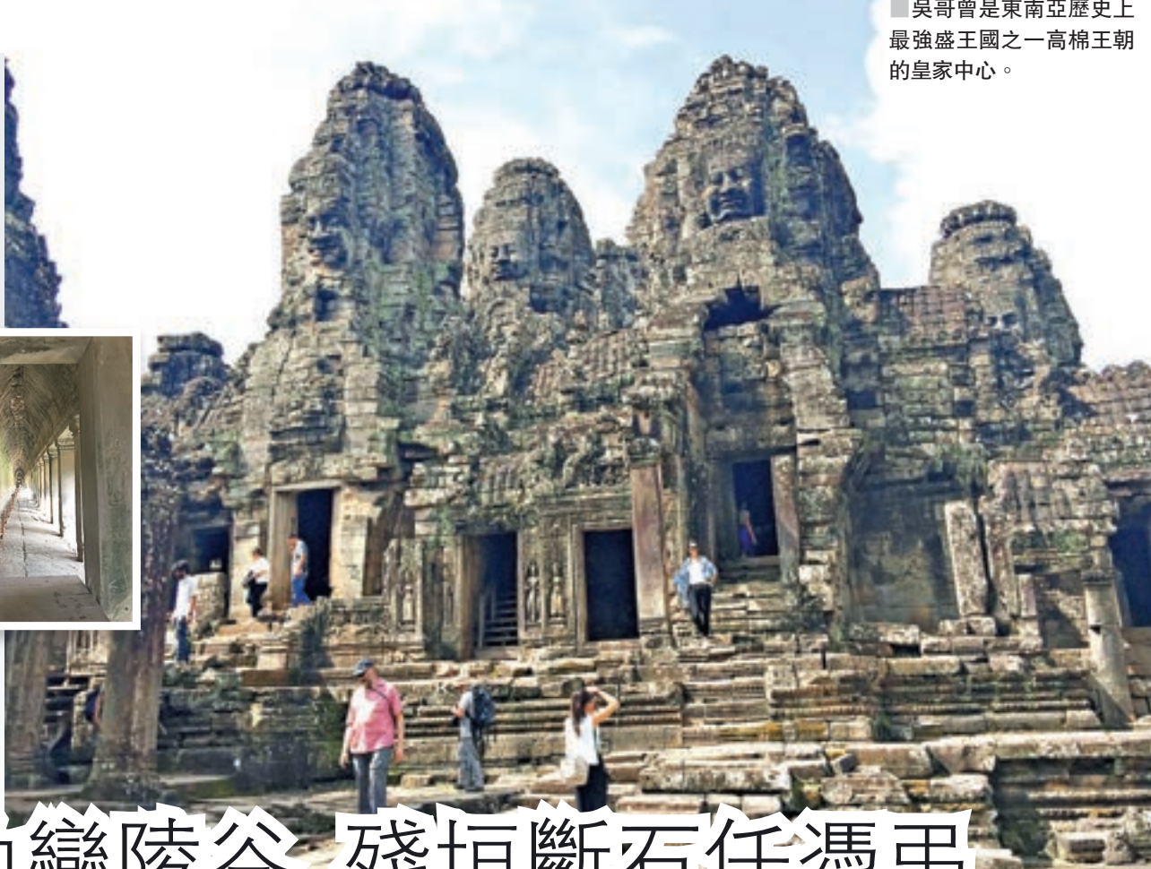
吳哥曾是東南亞歷史上最強盛王國之一高棉王朝的皇家中心。