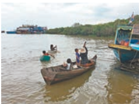
洞里薩湖的越南湖民在湖上居住，主要靠捕魚為生。

洞里薩湖又名金邊湖，雨季時湖面逾1萬多平方公里，是東南亞最大的淡水湖。湖水來自湄公河和洞里薩河，湄公河的上游是中國雲南的瀾滄江。現時湖上有許多