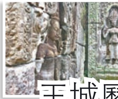
遺蹟牆壁及廊柱都雕刻着與宗教傳說相關的雕像和裝飾。