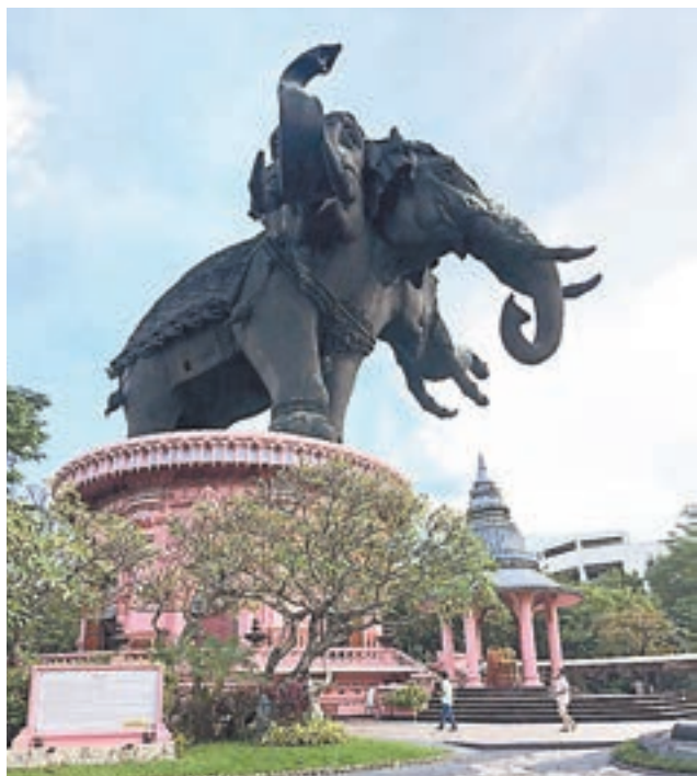
博物館內裡的裝飾的精細程度令人驚歎。

三頭象博物館是曼谷的新興旅遊景點，是私人博物館，坐落在圓形底座之上的三頭象，十分巨大威猛，令人遠遠已經感到它的氣場十足。三頭象博物館總高度為43.6米，約16層樓高，其中象身高29米。整座三頭象由精銅製造，重達250噸。