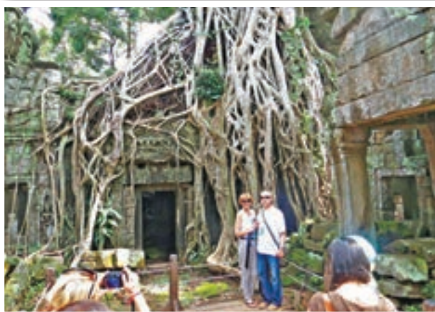
塔布龍寺是電影《盜墓者羅拉》的主要取景地。