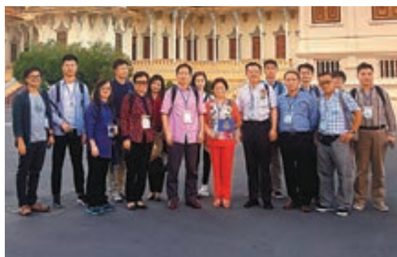
香港意得集團贊助今次「香港新聞界『一帶一路』採訪團」。

其間，香港與東盟正式簽署自由貿易協定，正好讓港媒了解這兩個「一帶一路」上重要東盟國家的發展狀況，並探討香港可以如何利用好自貿協定帶來的機遇，提供絕佳的機會；也正好讓香港各界，透過探訪團報道其他國家對接中國「一帶一路」戰略的具體行動，思考香港下一步對接「帶路」的策略。