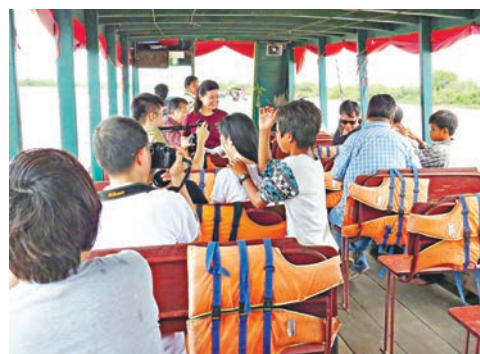
在接載遊客出湖的遊船上，有小孩逐個為遊客揮背討錢。

洞里薩湖又名金邊湖，雨季時湖面逾1萬多平方公里，是東南亞最大的淡水湖。湖水來自湄公河和洞里薩河，湄公河的上游是中國雲南的瀾滄江。現時湖上有許多