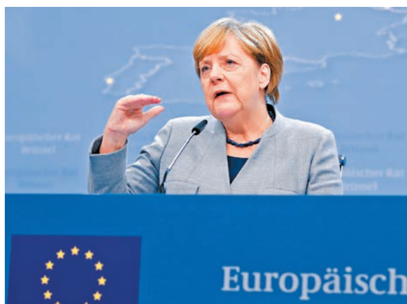
德國總理默克爾籌組新政府談判破裂，市場憂慮德國或重新大選，令政局不明朗。

歐元兌美元走勢，圖表走勢而言，歐元以上周二已升破一下降趨向線，技術上有延續升幅的傾向，若匯價可在短期內保持在1.18水平上方，則可望歐元繼續探高，其後目標可看至1.1880及1.20關口，進一步可參考9月份高位1.2090水平。然而，圖表亦見相對強弱指標及隨機指數均已自超買區域回落，需慎防歐元在近期多日上漲後會先作整理，較近支撐可留意50天平均線1.1770及1.1550。倘若以由四月低位1.0568至九月高位1.2092的累積漲幅計算，38.2%的回調為1.1515，進一步擴展至50%的調整幅度，則可看至1.1330水平。