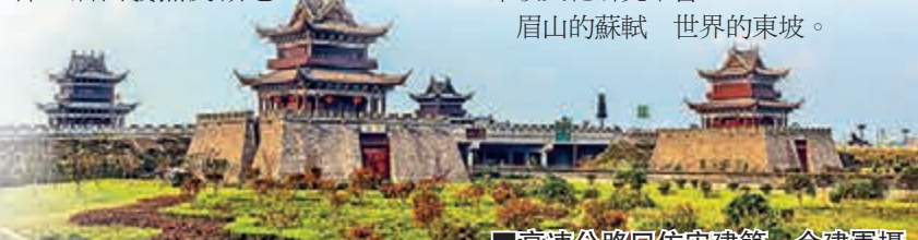
■高速公路回仿宋建築