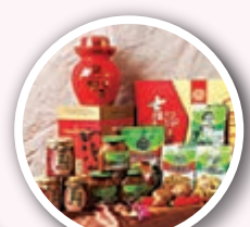
■東坡泡菜「吉香居」系列產品

特別值得一提的是，各大景區景點都可以品嚐到正宗的東坡肘子、東坡泡菜、東坡宴、東坡泡菜宴、東坡竹全席，領略舌尖上的眉山味道。