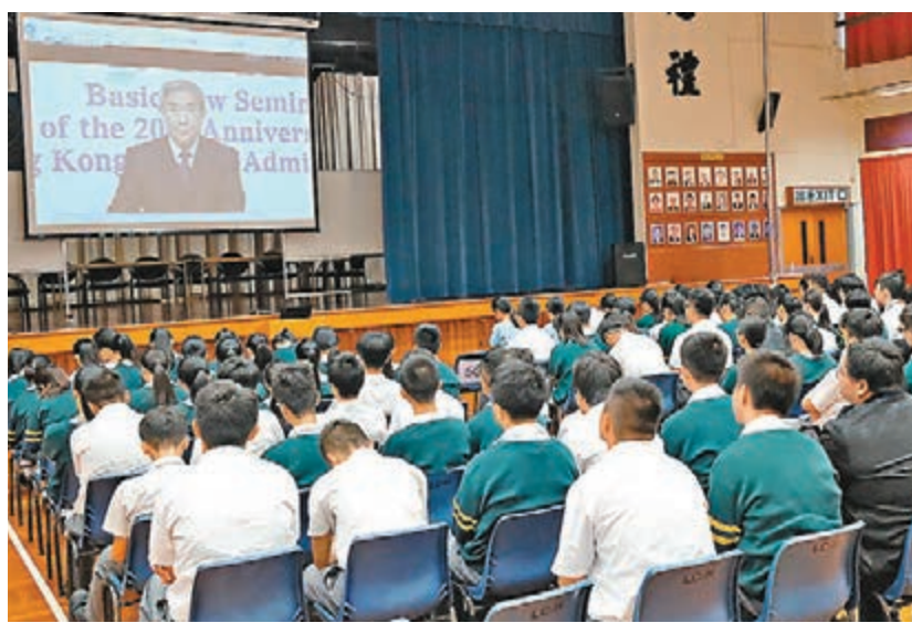
同學全神貫注看李飛主題演講直播。

香港文匯報訊(記者 文根茂)基本法委員會主任李飛近日出席基本法研討會並發表演講,約50所中學安排學生收看直播,但有人將之扭曲為「政治」安排。教育局局長楊潤雄昨日回應指,李飛是基本法權威,有專業知識及背景講解基本法看法,而安排直播與政治無關,「無論政治看法如何,都有責任認識基本法內容」。