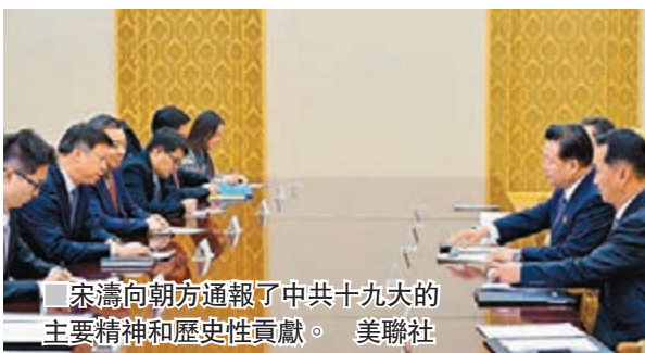
宋濤向朝方通報了中共十九大的主要精神和歷史性貢獻。

對於訪朝的時機，中國外交部發言人耿爽此前表示，在黨代會後相互通報情況，是中國共產黨和朝鮮勞動黨等社會主義國家政黨多年來交往的慣例。中朝發展友好合作關係符合雙方利益，有利於促進地區的和平穩定發展。