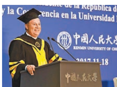
巴拉昨日在中國人民大學發表演講。

香港文匯報訊（記者江鑫嫻北京報道）正在中國訪問的巴拿馬總統巴拉昨日到訪中國人民大學，獲授該校名譽博士學位，並受聘為該校拉美研究中心名譽顧問。巴拉在隨後的演講中表示，這一榮譽是對兩國友誼的褒獎，作為首位訪問中國的巴拿馬總統，他會堅定奉行一個中國原則，並相信中巴雙邊關係會為兩國帶來好處，也會為整個拉大大陸乃至全世界和平帶來好處。