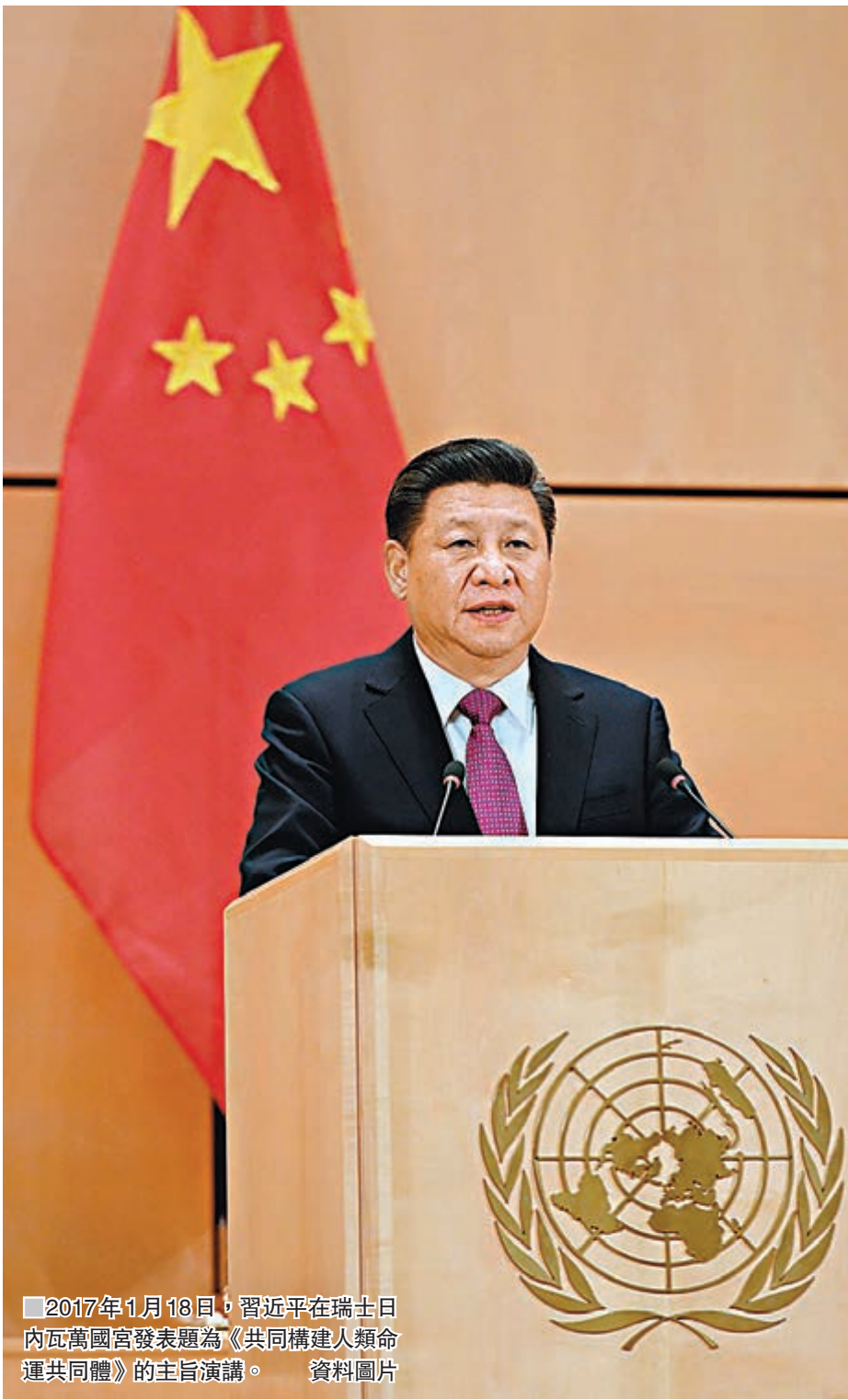
2017年1月18日，習近平在瑞士日內瓦萬國宮發表題為《共同構建人類命運共同體》的主旨演講。資料圖片