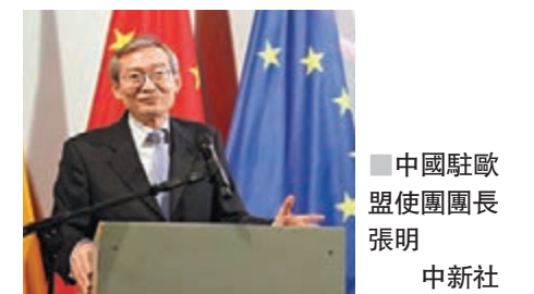
中國駐歐盟使團團長張明。

平力量和合作夥伴。在世界發展進程中，「中國發展帶來的絕對不會是『黃禍』，而是和平與發展的黃金機遇」。今後中國將繼續推進「一帶一路」建設，積極發展全球合作夥伴關係，相信這些都將為中歐關係乃至歐洲發展帶來機遇。