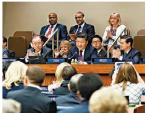
2015年9月27日，習近平在紐約聯合國總部出席並主持全球婦女峰會，發表重要講話。