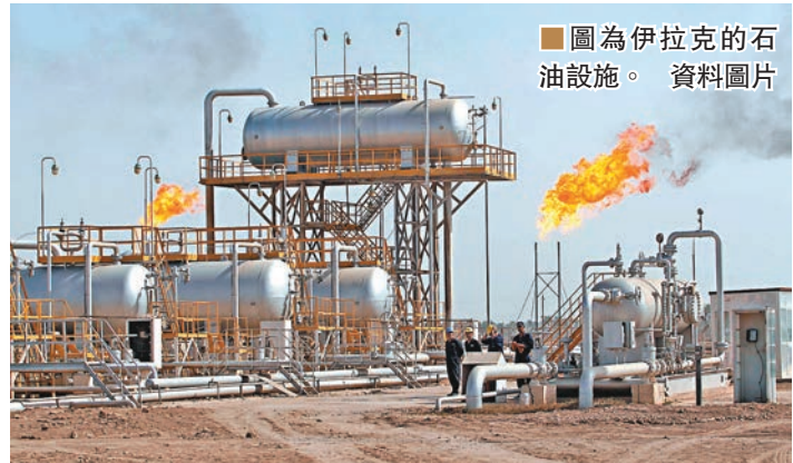
圖為伊拉克的石油設施。資料圖片

多項利多激勵近期油價走勢，今年6月下旬以來，布蘭特原油價格上漲超過4成，同一時間俄羅斯股市上漲近2成。除了中東地緣政治問題，OPEC（油組）的減產，再加上全球經濟復甦，都為油價的走勢帶來支撐，觀察俄羅斯的企業獲利年增率將在明年第一季由負转正，股市表現值得期待。