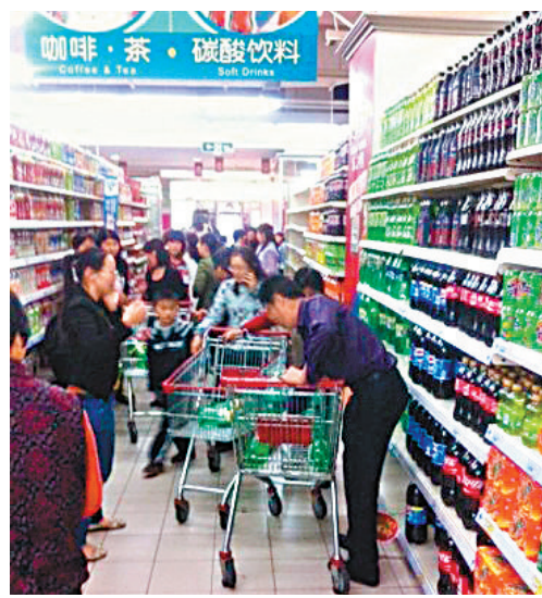
外資增持A股動作明顯，第三季底持市值比第二季底增加了17%，而加碼重心主要是大消費行業的龍頭股。

企業獲利與股市估值方面，A股第三季財報亮麗，整體獲利年增率18%，不含金融的獲利年增率則高達35%，符合中高速成長經濟體應有的表現。預期未來隨著供給側改革深入推進，市場供需將逐步改善，企業營收有望提升。目前上證50指數本益比12.5倍、香港國企指數只有8.9倍，皆低於歷史平均，企業獲利持續成長，有助A股及港股維持相對低位，提升其投資價值。