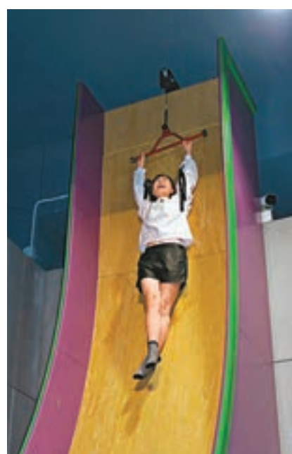
阿田玩吊高滑梯嚇得花容失色。

香港文匯報訊(記者李思穎)歐陽震華(Bobby)、田蕊妮、陳豪、張繼聰、李佳芯、龔嘉欣、邵美琪、吳業坤等一班劇集《誇世代》演員，昨日到鑽石中心進行宣傳活動。對於無綫剛發出指引要女藝員收起性感，看來大家都打起十二分精神，各女藝員均以密實打扮現身，反而是一眾男藝員玩遊戲時要戴上安全帶，立時下體激凸現形，Bobby更取笑坤哥「Big 鷗再現」，場面搞笑！