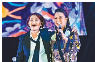
湯記重提5年前黎瑞恩為她做嘉賓時不慎在樓梯跌倒。

壓軸嘉賓譚詠麟在安歌環節出場，與湯記大唱勁歌掀起最後高潮，阿倫歡迎湯記加入「25歲」的家庭，表示在寶麗金年代雖未合作過，但始終是自己人，對方一個電話就立即答應前來，並大讚湯記唱歌有味道，笑道：「湯寶如調轉