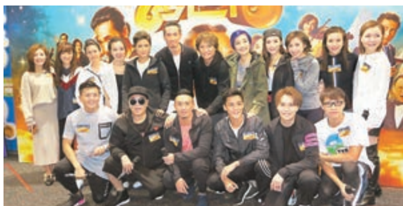
受「限性感令」影響，昨日一班女藝員的衣着好密實。