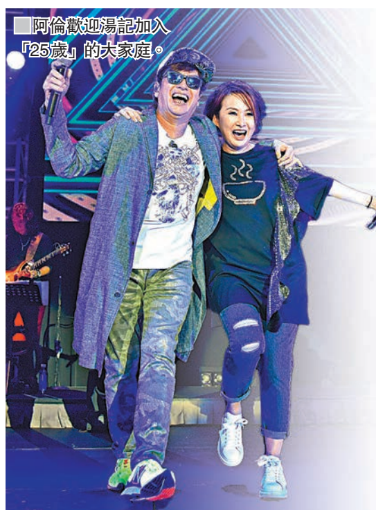
阿倫歡迎湯記加入「25歲」的家庭。

香港文匯報訊(記者吳文釗)湯寶如前晚於九展舉行25周年演唱會，獲好友周慧敏、袁潔瑩等人入場支持，更邀得譚詠麟、陳曉東、曹永康等做表演嘉賓。湯記與曹永康因合作主持《流行經典50年》結緣，二人合唱《相思風雨中》後，台上即互不相讓取笑對方，阿倫笑稱湯記手掌又肥又多肉，知她25歲入行現在已50歲，湯記就還擊對方少做演唱會嘉賓，正努力追到他54歲之齡。