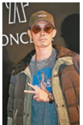
吳建豪有留意新版《流星花園》。