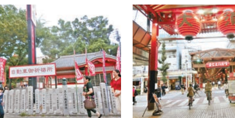
大須觀音寺祈福活動

鄭詠梅大鐘罩下先稟神。 紅伶跟大師學拜觀音手勢。 寺前有個地方專供車主為新車祈福的。