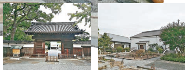
名古屋德川園環境清雅