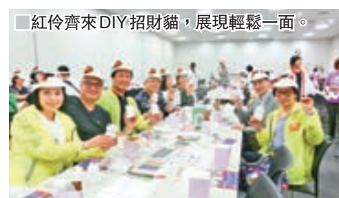
紅伶齊來DIY招財貓，展現輕鬆一面。

這裡還可以體驗陶藝，體驗DIY招財貓，你可以在招財貓、貓形茶壺、盤子、裝飾品上畫上自己喜歡的畫兒。你若想親手DIY自家招財貓，可去體驗區一嘗DIY彩繪自家的招財貓滋味，自製招財貓是在本白雪的貓形錢罌上畫眼耳鼻，塗妝完成後，再將一些寫有祝福語句圖案的貼紙黏上，便大功告成，難度不高，卻有滿足感，對貓痴來講是極好玩。在收費方面，製陶體驗1000日圓起；上彩體驗500日圓起+郵費（作品寄送）。