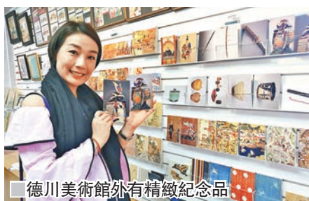
德川美術館外有精緻紀念品

除了看可愛的招財貓，名古屋市還有城堡、大須觀音寺、德川美術館等值得一遊。當中德川美術館位於名古屋東區德川町，包括旁邊的德川園在內，這片土地曾一度屬於威名赫赫的尾張德川家。尾張德川家是日本江戶幕府第一任征夷大將軍德川家康的兒子，而德川家康是日本戰國時代的大名，全名為德川次郎三郎源朝臣家康，為日本於1598年至1616年的實際元首，與其同時代的織田信長、豐臣秀吉並稱「戰國三傑」。