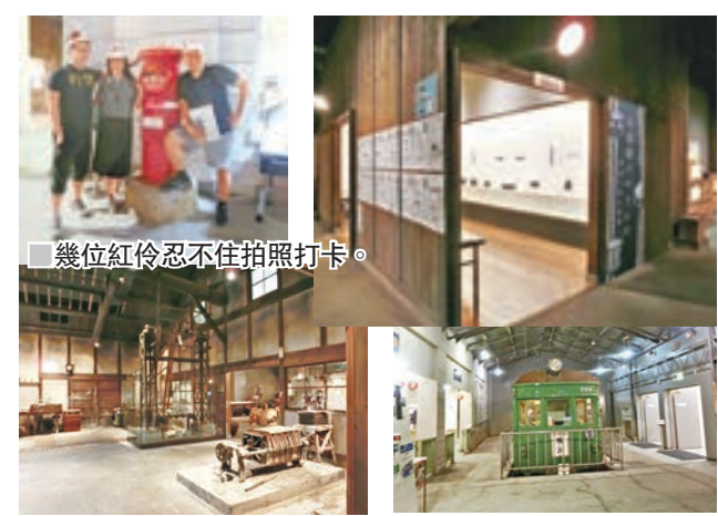
幾位紅伶忍不住拍照打卡

一列當時用過的瀨戶線列車，簡直就像拍攝電影的攝影棚一樣，幾位紅伶也忍不住拍照打卡。