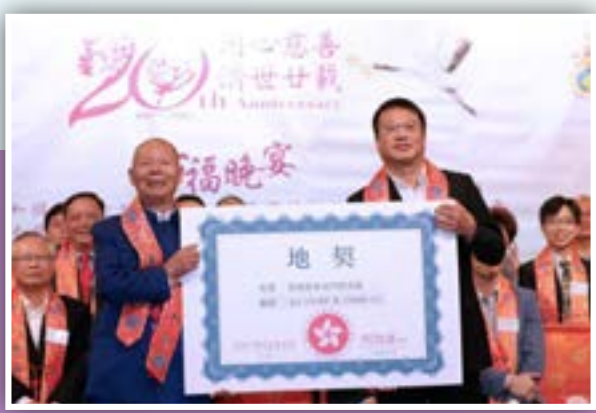
東井圓佛會聯同東井圓林東慈善基金、國際濟公文化協會及德教會濟修閣,在2017年11月4日晚上,於紅磡海逸皇宮大酒樓舉行十福晚宴。所謂十福是慶祝十個值得普天同慶的大喜事。