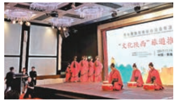
「文化陝西」旅遊推介會昨在香港喜來登酒店舉行。