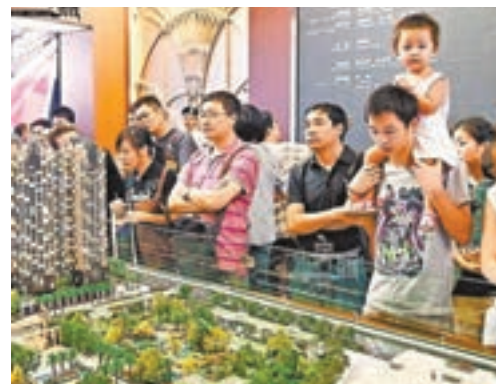
2015年以來深圳房價大幅上漲，高昂的生活成本成為削弱人才留深的主要因素。圖為市民正在參觀深圳一個樓房銷售處。資料圖片

香港文匯報訊（記者 王珏 北京報道）日前在京發佈的《深圳勞動關係發展報告（2017）》指出，雖然深圳一直是專業人才理想的就業城市，但近年來高昂的生活成本成為阻礙人才留深的主要原因，特別是2015年以來的房價大幅上漲，在一定程度上削弱了深圳市的就業吸引力，加快了勞動力向市外流出的速度。報告援引一項調查顯示，深圳專業人才中，只有17.7%有自有住房，57.40%在租房（不含廉租房）。