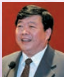
孫亞夫 海峽兩岸關係協會副會長 國務院台灣事務辦公室前副主任