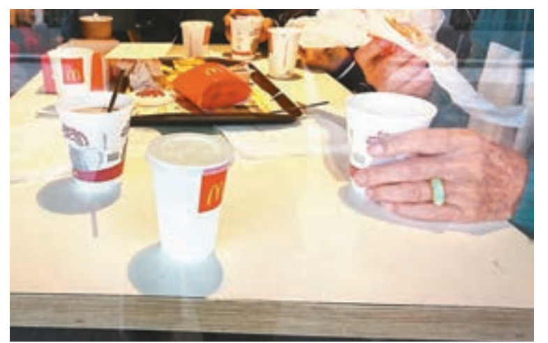
「綠色和平」估計麥當勞每日最少派發49萬件即棄塑膠產品。

香港文匯報訊(記者 顏晉傑)港人近年使用膠袋的數量雖然大減,但每日製造的塑膠垃圾仍達2,183噸,足以裝滿100個貨櫃,當中即棄餐具更是最常被市民忽略的垃圾來源之一。有環保團體發現,單是連鎖快餐店麥當勞,每日的早餐和午餐時段已經派發最少49萬件即棄塑膠產品。他們促請快餐企業負上企業社會責任,立即停用即棄餐具,並建議政府盡快推行廢物徵費。