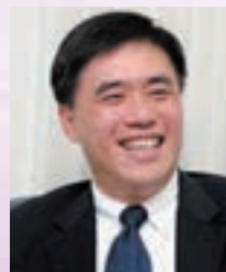
郝龍斌 中國國民黨副主席、前台北市長