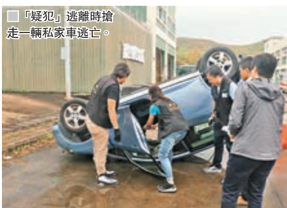
「疑犯」逃離時搶走一輛私家車逃亡。