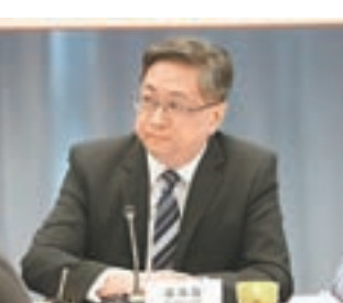
警務處處長盧偉聰。

風化案方面,盧偉聰指今年首9個月有48宗強姦案,較去年上升9%,其中有88%案件涉及相識的人,而涉及16歲或以下人士有10宗。非禮案則有819宗,上升10.5%,即78宗。