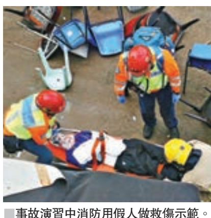
事故演習中消防用假人做救傷示範。

香港文匯報訊(記者 蕭景源)為應付重大事故及災難做好準備,提高公眾安全,警方聯同入境處、消防處、警管局等多個部門逾400人,昨在上水污水處理廠進行一項重大事故跨部門演習,模擬有「蛇匪」搶車越柙,撞入有政府官員出席的開放日活動現場,並挾持多名人質,釀成多人死傷情景。其間,警方新成立的專責反恐及大型事故相關罪行的專責小組亦首次亮相參與演習。