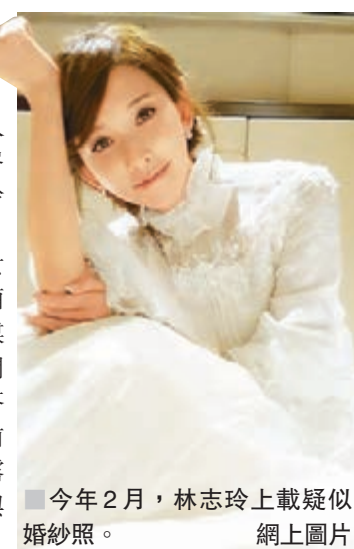
今年2月，林志玲上載疑似婚紗照。

香港文匯報訊 言承旭和林志玲日前被踢爆馬來西亞蜜會，更是有圖有真相，男方之後大方承認復合，而林志玲媽媽吳慈美日前受訪時透露女兒與言承旭其實一直保持好朋友關係，也公開支持兩人復合，令外界紛紛猜測兩人好事將近。昨日更有傳言兩人早於今年年初已計劃飛往峇里島秘密結婚，並準備好婚紗，無獨有偶，今年2月林志玲上載一張疑似婚紗照到網上，更讓結婚傳聞疑幻似真。有指言林兩人在馬來西亞已逾40小時沒離開過酒店，女主角林志玲前日下午終於現身，身穿白衫黑裙的她離開酒店快步走上車，趕赴機場搭乘航班到重慶工作。不少傳媒早已守候機場，當林志玲一出現，即時一擁而上，追問「是否已經與言承旭復合」，可是林志玲全程未有回答記者提問，但戴上墨鏡的她一直保持微笑，更於入關前向傳媒舉V兼揮手道別，可見心情不俗。而有空姐透露往重慶航班上遇上林志玲，對方表現親切，更逐一與機艙服務員合照。