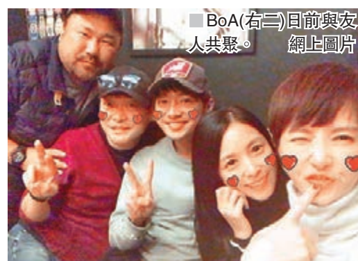
BoA(右三)日前與友人共聚。

亞巡由明年3月17、18日於深圳展開;之後香港站定於3月31日假紅館舉行，今次是安室首次亦是最後一次踏上紅館舞台開騷;5月19、20日則會去台北小巨蛋開騷。門票發售日期及票價等詳情仍有待公佈，不過相信定必掀起撲騰潮。