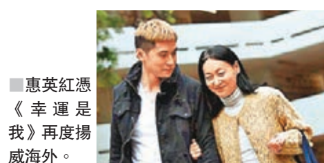
惠英紅憑《幸運是我》再度揚威海外。

電影節》榮獲主競賽(Offerial Selection)最佳女主角。此外，《幸運是我》導演羅耀輝亦獲得該競賽部分的最佳導演，羅導出席頒獎禮，他亦代表小紅姐上台領獎。