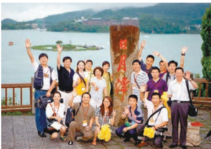
大陸崛起，台灣可順勢發展。圖為大陸遊客遊覽日月潭。資料圖片

其實，面對大陸崛起，島內除「台獨」死硬派之外的絕大多數人不應緊張，而應慶幸期待。一個和平崛起的大陸，首先是台灣的機遇和福音。同文同種的世界工廠和世界市場就在身邊，還