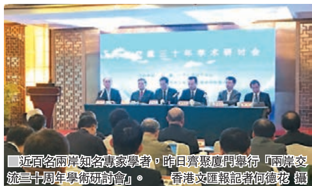
近百名兩岸知名專家學者，昨日齊聚廈門舉行「兩岸交流三十周年學術研討會」。

香港文匯報訊（記者 何德花 廈門報導）近百名兩岸知名專家學者，昨日齊聚廈門舉行「兩岸交流三十周年學術研討會」。開放交流三十年來，兩岸學者的交流也從敵對、防衛走向理解、合作、融合的狀態。