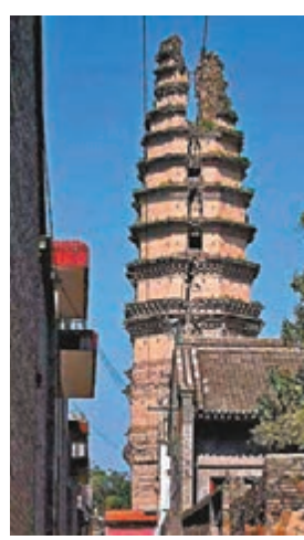
修復前的「裂塔」。網上圖片