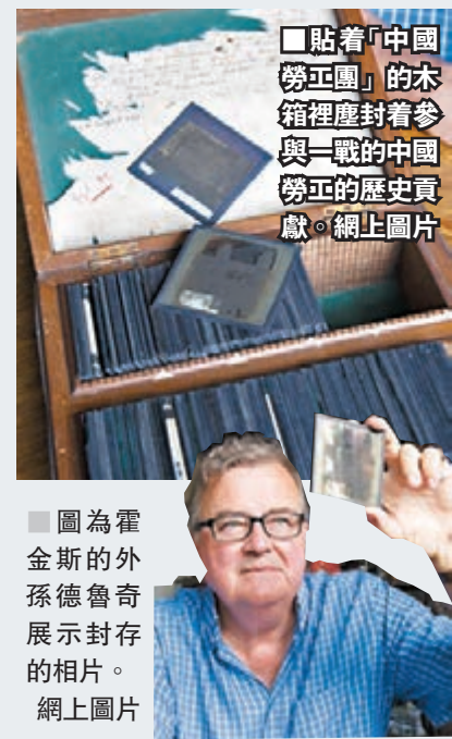
圖為霍金斯的外孫德魯奇展示封存的相片。