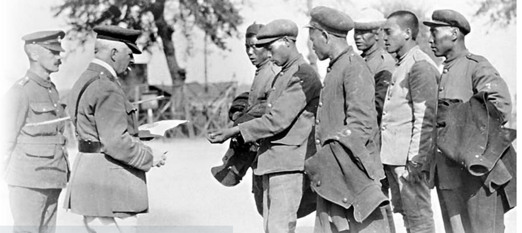
中國勞工所做的工作方便了更多的英國士兵完成其他的任務。