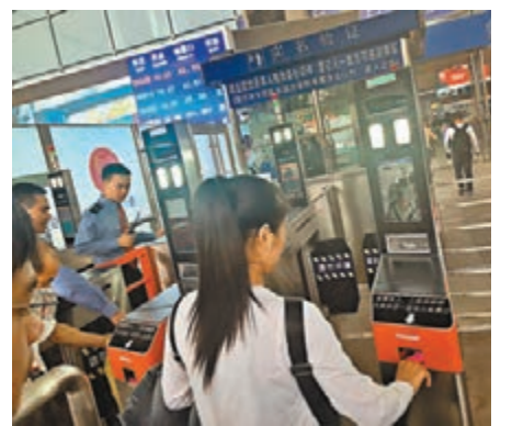
深圳北站實施「刷臉」進站。

香港文匯報訊(記者郭若溪 深圳報道)前來深圳北站乘車的旅客近日發現，在東、西兩個實名制驗證區域新增了自助核驗閘機。據記者昨日了解，實名制驗證區域新增了16台自助核驗閘機，持二代身份證的旅客可以通過「刷臉」自助進站；一般情況下，旅客可在3秒至5秒內「刷臉」進站。