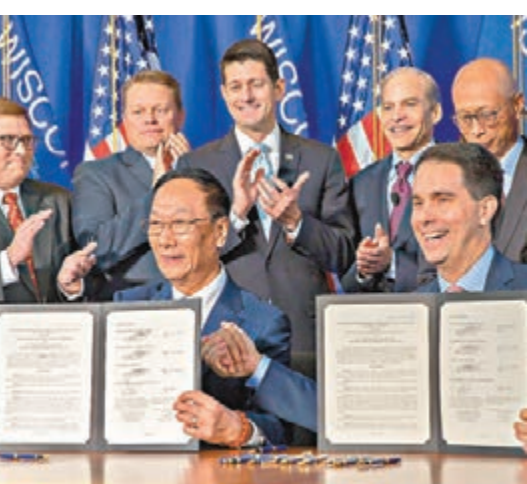
鴻海集團董事長郭台銘(前排左)與美國威斯康辛州州長華克昨日簽下該州史上最大的經濟發展合約。

鴻海董事長郭台銘表示，將結合技術、勞動、資本密集優勢，打造面積達1,000英畝的園區將作為在美國推動8K+5G生態系統的基礎，所生產的世界最先進尺寸液晶面板，應用於最新世代電視、自動駕駛汽車、航空器系統以及教育、娛樂、健康醫療、尖端製造、辦公室自動化、互動零售、安全生活等。並且在美國的教育、醫療與健康照護、娛樂、運動、安全以及智能社區等產業領域的人才培育、技術研發、垂直整合，擔當關鍵角色。