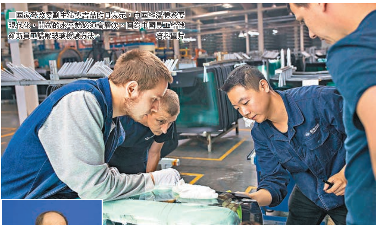
國家發改委副主任寧吉喆昨日表示，中國經濟體系要現代化，開放的水平就必須高層次。圖為中國員工給俄羅斯員工講解玻璃檢驗方法。資料圖片

寧吉喆強調，未來中國不僅要向發達國家開放，而且要向發展中國家開放，實現貿易、投資開放市場多元化的政策，實行多元化的發展。