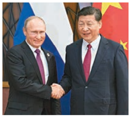
■習近平10日在越南峴港會見普京。

戰略協作夥伴關係作為對外政策的優先方向。很高興習主席今年夏天對俄羅斯的成功訪問推動兩國各領域關係取得積極進展。雙方要落實好我同習主席達成的重要共識，密切高層交往，深化經貿、能源、農業、基礎設施、航空製造業、航天等各領域合作，擴大人文交流。俄方願加強同中方在國際地區事務中的合作，密切亞太經合組織等多邊機構中的溝通協調，推進亞太自貿區建設。 習近平和普京還就朝鮮半島局勢等共同關心的問題深入交換了意見。