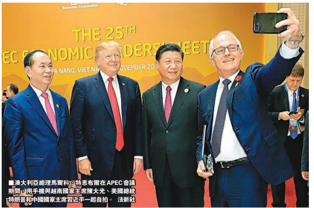
■澳大利亞總理馬爾科·特恩布爾在APEC會議期間，用手機與越南國家主席陳大光、美國總統特朗普和中國國家主席習近平一起自拍。

習近平指出，中韓兩國是搬不走的近鄰，也是天然合作夥伴。建交25年來，友好交流、合作共赢始終是中韓關係主旋律。中韓兩國在促進各自經濟社會進步、實現地區和平穩定繁榮方面有着廣泛共同利益。良好的中韓關係符合歷史和時代大勢，也是兩國人民共同願望。中方重視同韓國的關係，願意同韓方一道，致力於推動兩國關係的健康穩定發展。