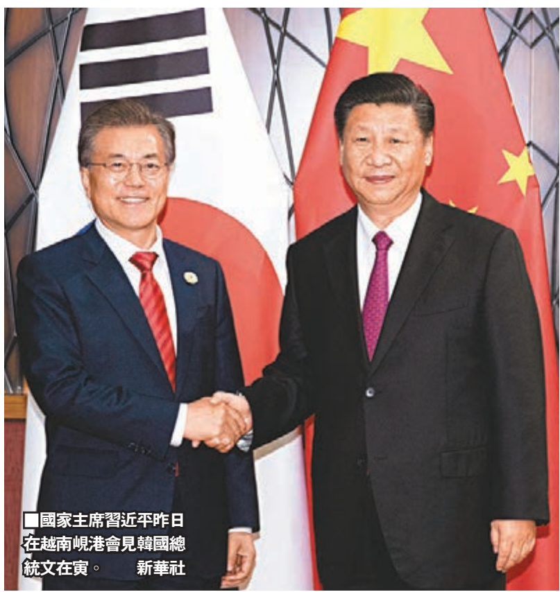
■國家主席習近平昨日在越南峴港會見韓國總統文在寅。

香港文匯報訊 據人民日報客戶端報道，國家主席習近平11日在越南峴港會見韓國總統文在寅時強調，中韓關係正處於關鍵時期，在事關重大利害關係問題上，應該本着對歷史負責、對兩國人民負責的態度，作出經得起歷史考驗的決策。兩國元首均提出，要以和平方式解決朝核問題。