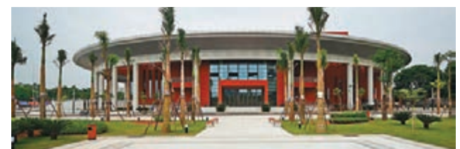
■越中友誼宮將正式投入使用。