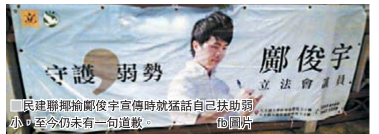
民建聯揶揄鄺俊宇宣傳時就猛話自己扶助弱小，至今仍未有一句道歉。