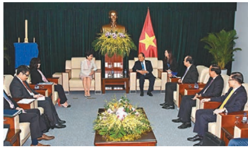
林鄭月娥(上圖左四)昨日上午在越南峴港與越南總理阮春福(上圖右五)會面，就雙方關注的議題交換意見。右圖為林鄭月娥與阮春福握手。