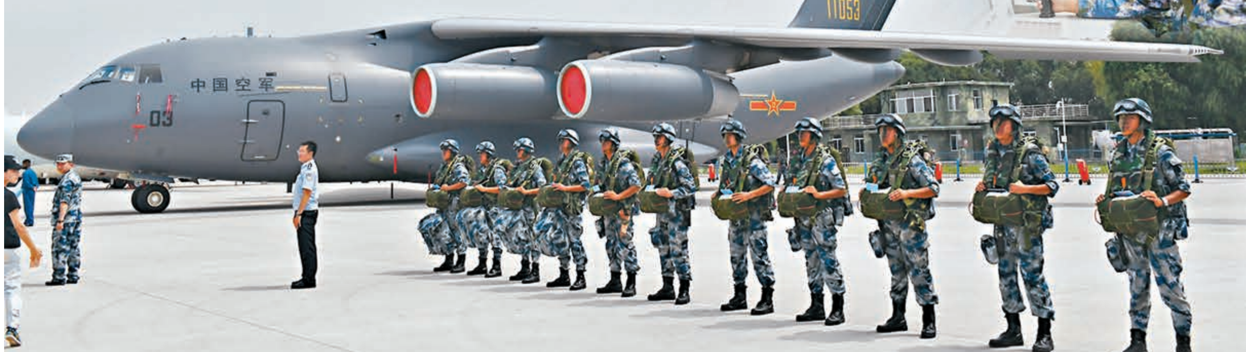
今日是中國空軍68周年紀念日,殲-20、運-20已開展編隊訓練,向全疆域作戰的現代化戰略性軍種邁進。圖為中國空軍8月在吉林長春舉辦航空開放活動。資料圖片

不斷增強,為建設世界一流現代化空軍提供了雄厚的物質保障。當前,空軍正按照「空天一體、攻防兼備」的戰略目標,繼續深化改革,推進戰略轉型,不斷錘鍊空天戰略打擊能力、空天防禦能力和空中戰略投送能力,努力建設強大的現代化空軍,為實現黨在新時代的強軍目標砥礪奮飛。