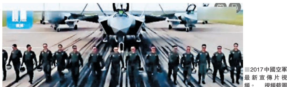
2017中國空軍最新宣傳片視頻。視頻截圖

新思想引領新時代,新使命開啟新征程。片中稱,在習近平新時代中國特色社會主義思想指引下,中國空軍40萬官兵不忘初心、牢記使命,改革創新、砥礪奮飛,努力建設強大的現代化空軍,為實現黨在新時代的強軍目標、全面建成世界一流軍隊作出新的更大貢獻,更好地擔當起黨和人民賦予的新時代使命任務。