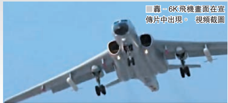
轟-6K飛機畫面在宣傳片中出現。視頻截圖

香港文匯報訊(記者葛沖北京報導)在迎接68周年紀念日之際,中國空軍向海內外發佈最新中英文版宣傳片《中國空軍奮飛新時代》,立體展示這支戰略性軍種的使命擔當和強軍夢想。片中,殲-20、運-20、殲-16、殲-10C、轟-6K等多架新型「明星戰機」集中亮相。