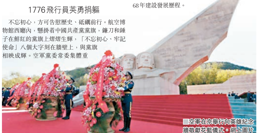
空軍在京舉行向英雄紀念牆敬獻花籃儀式。網上圖片

飛行是勇敢者的事業。英雄牆上,鐫刻着人民空軍在作戰和訓練中犧牲的1,776名飛行人員烈士和被授予榮譽稱號的263名英雄人物的名字。一個個英雄的名字,承載着一段段歷史,更紀念了人民空軍68年建設發展歷程。