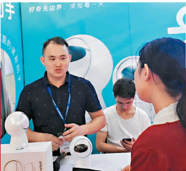
■普得技術研發的兒童機械人可以純英語對話。

深圳普得技術公司負責人表示，他們研發的小墨雙語助手機械人可以與中小學生進行英語陪練、智慧家庭和語音助手，可以幫助學習英語單詞、句子和翻譯。負責人指，許多中小學生缺乏可以練習英語的對象，該機械人可以讓他們進行純英語對話，多練一些口語。此外，機械人還內置有故事和百科，讓他們增長見識。現場所見，確有不少家長和代理商對該機械人十分有興趣。