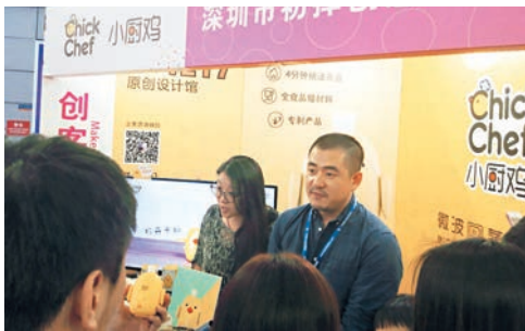
■微波爐煮蛋器數分鐘可煮熟雞蛋。

眾所周知，如果直接將雞蛋放進微波爐「叮」，係會發生爆炸的。為解決這一問題，深圳初擇創意文化發展有限公司展館負責人稱，公司的5人創業團隊研發出微波爐煮蛋器專利產品，只要將雞蛋鑽一細微小孔，放入煮蛋器，裡面加一點水，再放入微波爐，僅三四分鐘就會煮熟。新產品省去了以往將蛋放在鑊裡煮太久的麻煩，使用煮蛋器還可保證煮出的蛋維持在最佳的煮熟時間。產品剛剛量產，一個月已售出萬個，單個售價59元人民幣，下個月開始線上銷售。