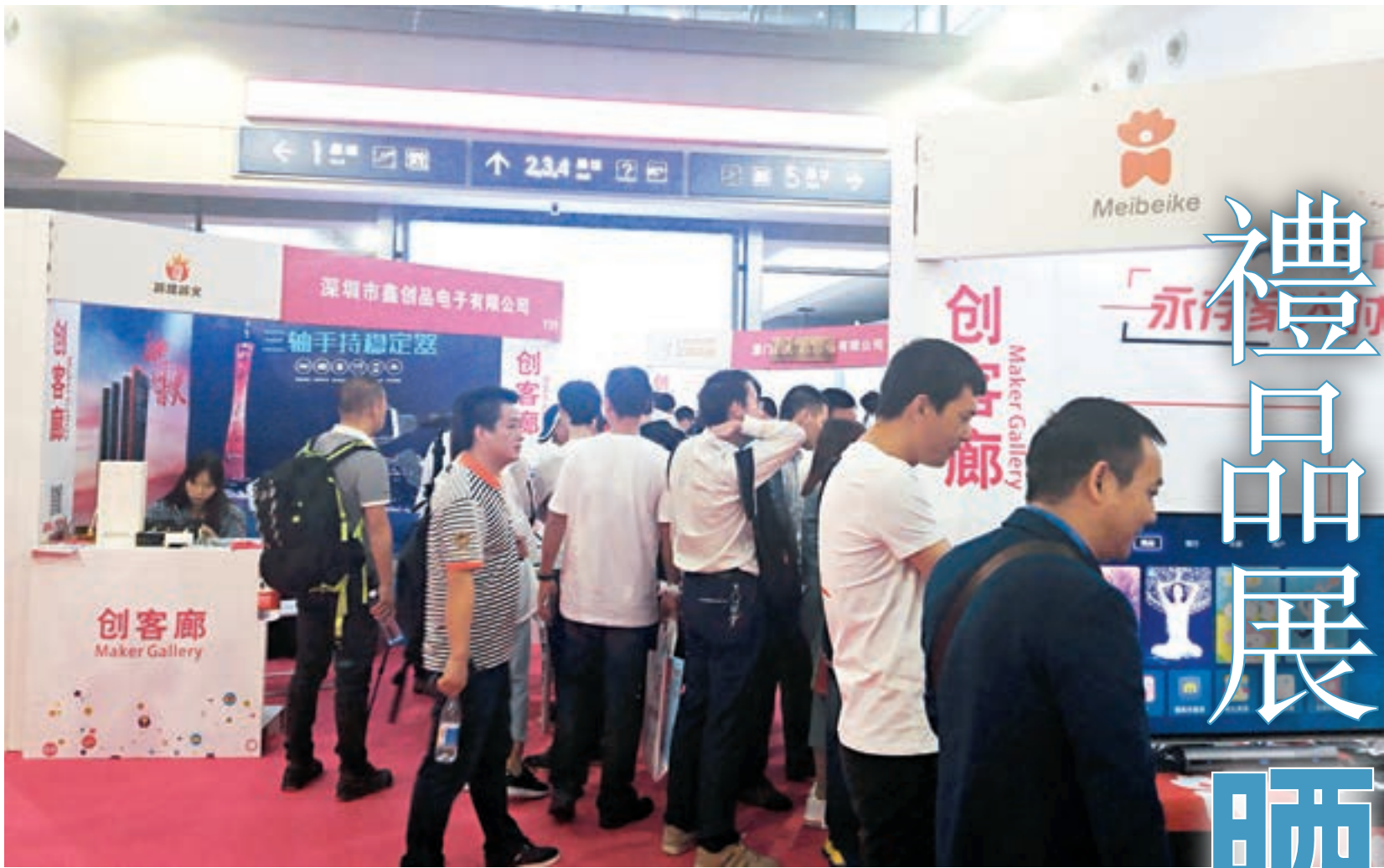
■深圳禮品展吸引逾30家創客參展，眾多創新產品引人注目。