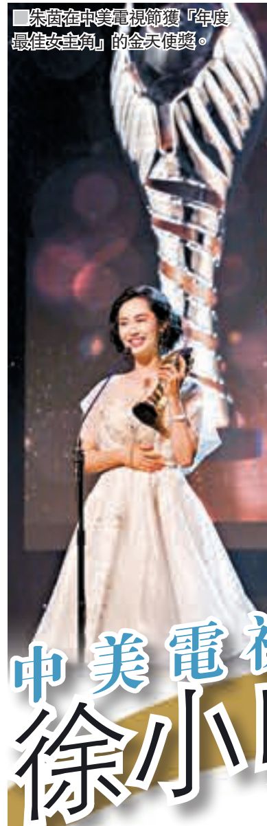
朱茵在中美電視節獲「年度最佳女主角」的金天使獎。