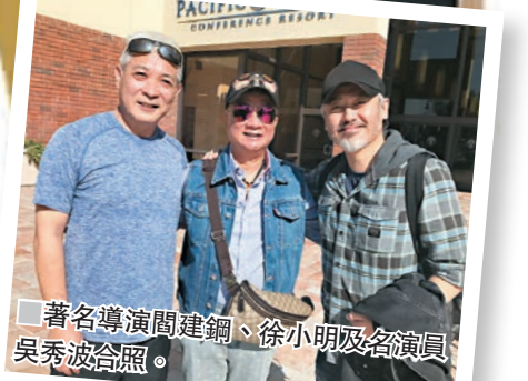
著名導演閻建鵬、徐小明及名演員吳秀波合照。