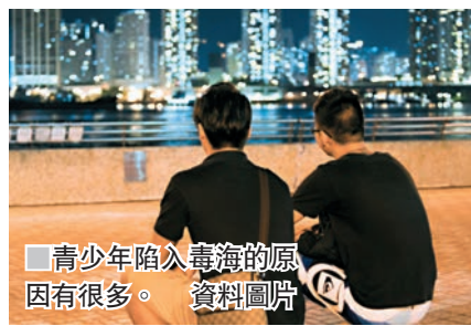
青少年陷入毒海的原因有很多。

精神科醫生 ：有經濟能力的吸毒者求醫，通常有兩個原因，一是個人健康出現問題，影響日常工作，他們一般覺得腦功能衰退，故主動求診，戒毒成功率較高；另一類是父母帶往求醫的吸毒者，邊醫邊繼續吸，很多時不會成功。