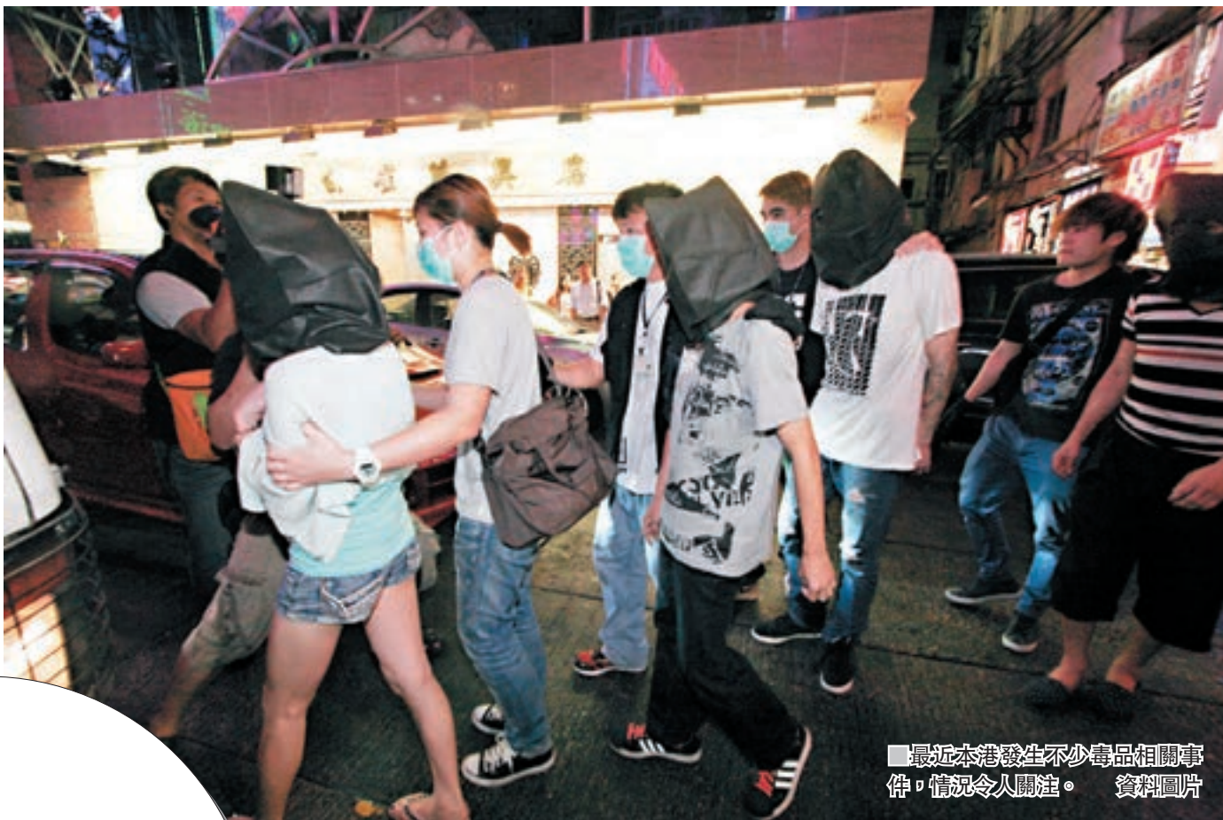
最近本港發生不少毒品相關事件，情況令人關注。資料圖片