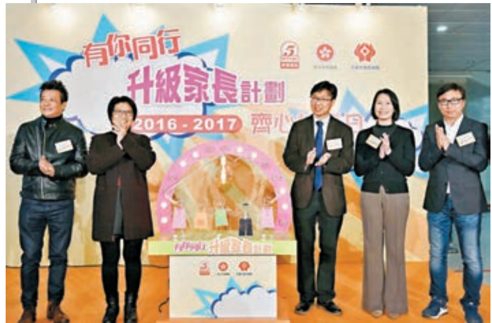
禁毒常務委員會等推出「升級家長計劃2016-17」，並舉辦活動，以加強家長對青少年毒品問題的關注。

監察人權團體 ：當局的建議侵犯人權，是強迫市民接受非自願醫療檢驗，即使警察有合理懷疑，被要求驗毒者在定罪前仍是疑犯，是否需接受驗毒涉複雜法律理據，宜交予社工或醫護人員處理。