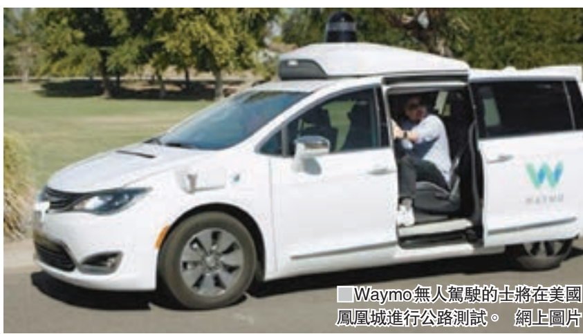
Waymo無人駕駛的士將在美國鳳凰城進行公路測試。

Waymo稱過去8年不斷測試自駕系統，公路測試里數達800萬公里，今次選擇在鳳凰城進行測試，是因當地不會下雪及降雨量低，承認自動車暫未能適應惡劣天氣。儘管如此，自動車已配備完善的剎車、操控、動力及電腦系統，全程無需司機。若乘客途中遇到問題，可按後座按鈕與營運中心人員聯絡，若想提早下車，也可透過車上按鈕要求停在路邊。