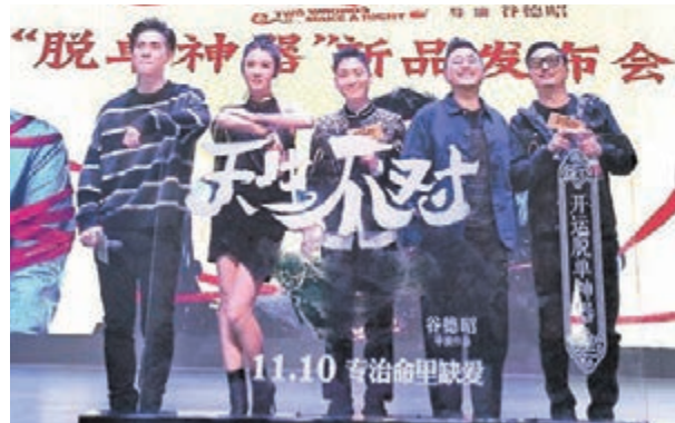
電影《天生不對》廣州路演。