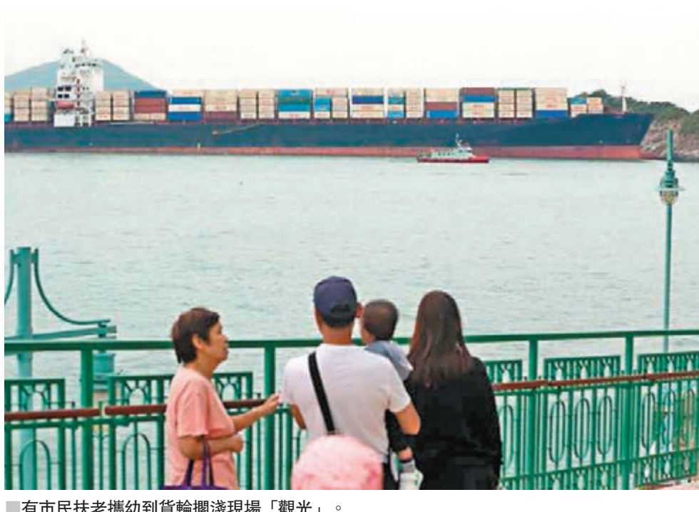
有市民扶老攜幼到貨輪擱淺現場「觀光」。

香港文匯報訊(記者 蕭景源)一艘300米長貨櫃輪前晚在香港仔海怡半島對開海面失控直撞向火藥洲擱淺，由於貨櫃輪船身巨大，昨仍未能拖走。巨輪撞島奇景曝光後，迅速成為另類觀光熱點，昨吸引不少市民到海怡半島海旁隔岸拍照留念。至昨深夜當局趁天文大潮漲成功將船拖離，暫停泊附近海面待查。 失事的貨櫃輪「TOSKA」，船身總長294.1米，寬32米，總噸位近5.5萬噸，船上當時載有大量貨櫃，上周五(3日)才由台灣高雄出發，詎料前晚經港準備前往深圳途中失事。 昨日肇事貨櫃輪仍擱淺在火藥洲岸邊，船頭輕微損毀，水警輪、消防輪及海事處船隻一直在附近海面戒備。 其間不少市民專程到鴨洲洲海怡半島海旁，隔岸觀看難得一見的巨輪撞島奇景，並拍照留念，場面熱鬧。 事發前晚9時許，該艘貨櫃輪駛經海怡半島對開東博寮海峽時，突然失控直撞向火藥洲，船頭位置一度擦出火花，所幸船上28名船員並無受傷，其後報警求助。 海事處發言人昨日表示，該處正與船隻的本地代理商討論跟進工作，包括研究將貨輪拖離現時擱淺位置的可行方案，及調查意外原因。該處暫時沒有收到漏油報告。