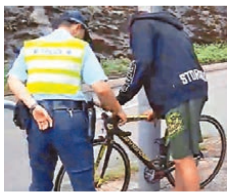
警員在現場檢查撞傷學生的單車。電視截圖