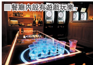
餐廳內設有遊戲玩樂