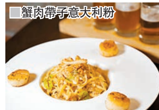
蟹肉帶子意大利粉

「好奇於飯」，即香麻貢菜米鴨配馬爹利藍帶，色澤鮮綠、質地爽口的貢菜配上肉質鮮嫩的米鴨，拌以豆瓣醬混合成一道開胃的冷盤，味道香醇，是一道不錯的佐酒小食。「水中藝術」，即至尊焗蟹蓋配藍帶，焗蟹蓋是經典粵菜之一，採用新鮮手拆肉蟹，每個蟹蓋均用上整隻肉蟹