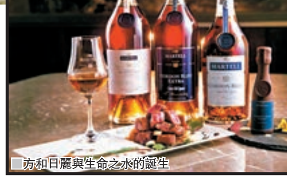
方和日麗與生命之水的誕生