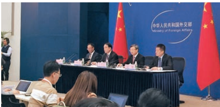
■外交部昨日舉行中外媒體吹風會,介紹中共中央總書記、國家主席習近平出席亞太經合組織第二十五次領導人非正式會議並對越南、老撾進行國事訪問有關情況,並回答記者提問。

香港文匯報訊(記者 葛沖 北京報道)亞太經合組織(APEC)第二十五次領導人非正式會議將於下周在越南峴港舉行。對於APEC會議期間大陸領導人是否會與台灣地區代表宋楚瑜舉行正式會晤等問題,中國外交部副部長李保東昨日在外交部中外媒體吹風會上回應稱,中國台北參與APEC的活動必須符合一個中國的原則和APEC有關的諒解備忘錄。