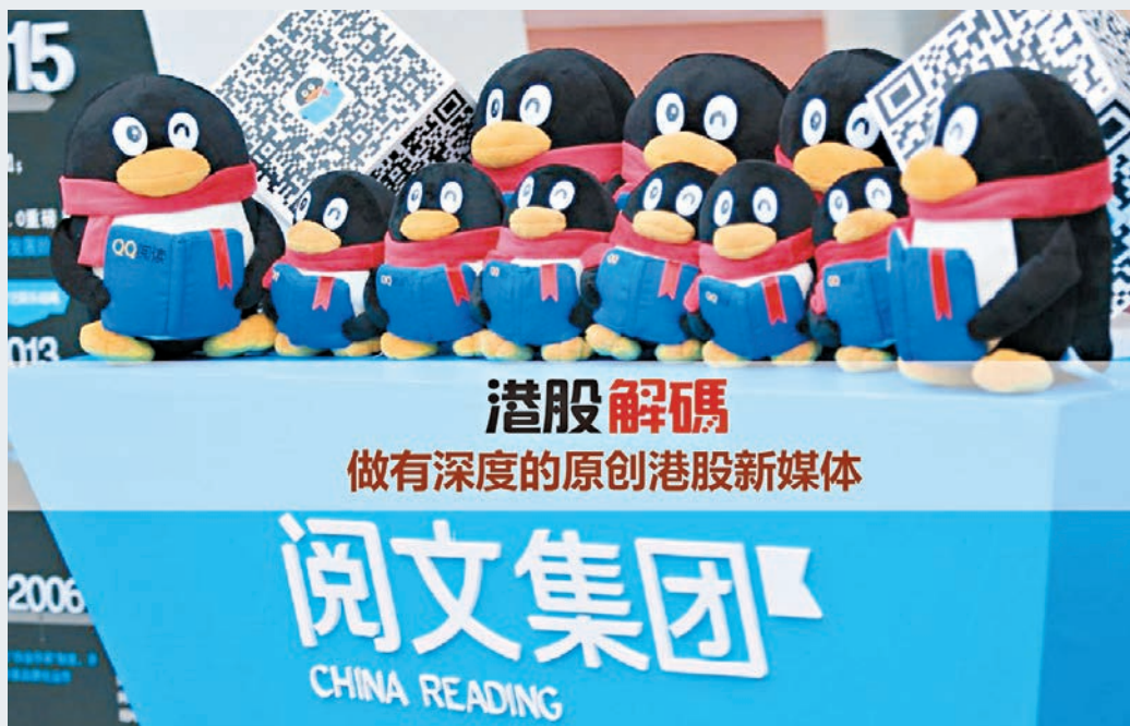
市傳閱文一手中籤率僅約7.7%。

香港文匯報訊(記者 張美婷) 凍資逾5,200億元的閱文集團(0772)招股反應火爆,市傳場外暗盤升至75元,但只有買盤沒有賣盤。一股難求還反映在其中籤率上,市傳一手中籤率僅約7.7%,按閱文入場費1.1萬元計,即需認購110萬元(即2萬股100手)才穩奪一手。在認購閱文的逾40萬人中,佔1/4逾10萬人為「一手黨」,當中約8,000人可抽到一手。抽中閱文瞬間成為城中「幸運兒」。