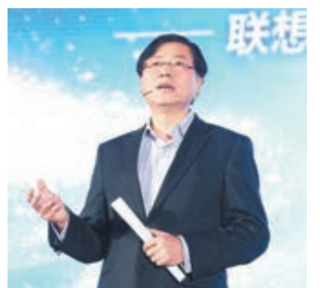
聯想集團轉型已上軌道,圖為董事長兼CEO楊元慶。

報告強調,聯想持續致力改善季比季的除稅前溢利,並持續投資以達至長期增長。個人電腦業務盈利穩健,並能推動移動業務和數據中心業務加速增長的需要,反映轉型已上軌道。展望未來,儘管市場環境於短期內仍然充滿挑戰,然而,集團目前擁有更高效的組織架構,讓各個業務具有更高的客戶專注力和更具吸引力的產品組合。配合切實的執行能力,集團依然有信心各個業務均建立領導地位以達至盈利性增長。