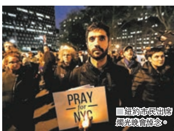
紐約市民出席燭光晚會悼念。