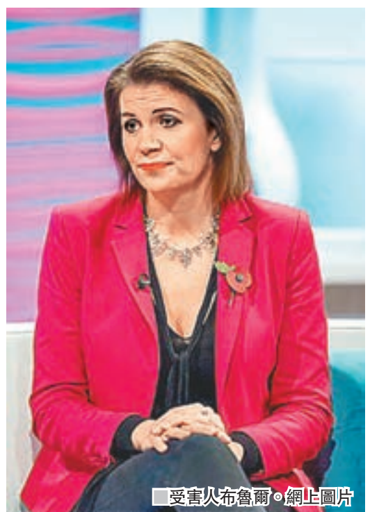
受害女布魯爾。