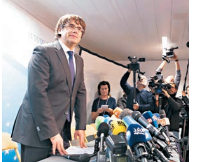
身在比利時的普伊格德蒙特未有出庭。