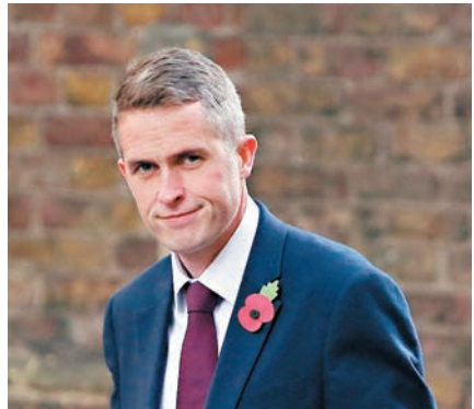
保守黨首席黨鞭韋廉信獲委任為新防相。

65歲的房應麟早前就2002年時在保守黨會議上，曾多次把手放到女記者布魯爾的膝蓋上道歉，他前日發表聲明，承認過往部分行為失德，感到懊悔，經反省後決定辭去國防大臣一職，但會繼續擔任國會議員。房應麟接受英國廣播公司訪問時，明確表示時移勢易，許多10至15年前無傷大雅的行為，在現今標準下已變得難以接受，不過他認同國會需跟隨社會步伐，提升操守。