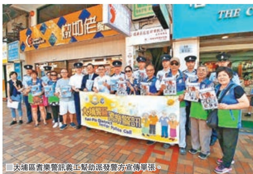
大埔區耆樂訊義工幫助派發警方宣傳單張。

「愛心零錢」計劃的援助金額上限為每位學生每星期200元，既有借貸，亦有津貼，學生可按他們的需要逐次申請，北區愛心基金和學校亦會了解他們的情況，作出相應的安排。「近日我們接收了一個個案，有一位學生不慎受了傷，但因為沒錢看醫生，就沒理會傷患，像這樣的情況我們也會撥款支援。」