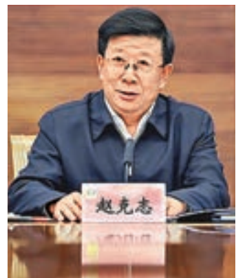
■ 公安部黨委書記趙克志昨日在京主持召開公安部黨委（擴大）會議並講話。

趙克志今年64歲（1953年12月生），山東萊西人，曾任青島團山東省萊西縣委書記、即墨市委書記、山東省城鄉建設委員會主任、德州市委書記等職。2001年，由德州市委書記升任山東省副省長。2006年，他首次跨省履新江蘇省委常委、副省長，四年後再次跨省履新，升任貴州省委副書記、省長，由此成為正省級幹部。2012年趙克志當選中央委員，隨後接班上調中央任職的栗戰書，升任貴州省委書記。2015年7月底，趙克志補缺中共十八大以來首位落馬的在任省委書記周本順，北上轉任河北省委書記。今年10月底，他卸任河北省委書記。