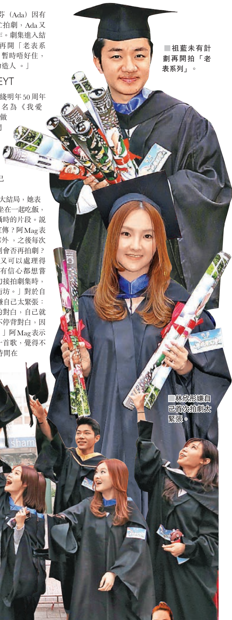
祖藍未有計劃再開拍「老表系列」。