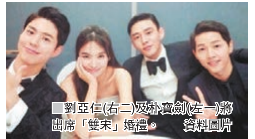
劉亞仁(右二)及朴寶劍(左一)將出席「雙宋」婚禮。資料圖片

香港文匯報訊（記者凡文）宋仲基與宋慧喬的世紀婚禮今日舉行，最近婚慶場地曝光，「雙宋」將選在韓星大婚首選的首爾新羅飯店（Shilla Hotel）完成終身大事。為保「雙宋」私隱，有網民近日透露見酒店方面特別於戶外場地加裝帳篷，嚴防他人從高空偷拍。即使婚禮一直採保密措施，但總會洩露風聲，原本盛傳婚禮主持由宋仲基的好兄弟李光洙擔任，但光洙否認，主持一職將交由宋仲基的中學同學負責，有指光洙會借「雙宋」的好友劉亞仁為二人讀信致辭，向一對新人獻上祝福。宋仲基的同門師弟朴寶劍將於婚宴上演奏鋼琴，喬妹好姊妹玉珠鉉則獻唱祝賀歌。至於大中華粉絲就十分好奇喬妹好友黎明，以及曾與「雙宋」合作的章子怡會否出席婚禮祝賀？