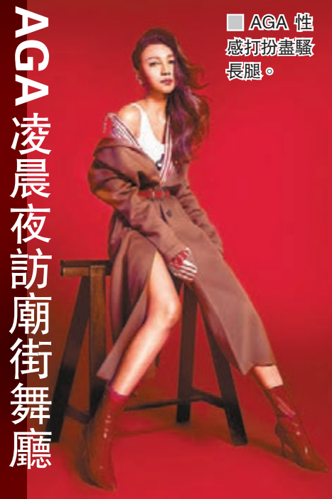
AGA性感打扮盡顯長腿。

香港文匯報訊（記者凡文）宋仲基與宋慧喬的世紀婚禮今日舉行，最近婚慶場地曝光，「雙宋」將選在韓星大婚首選的首爾新羅飯店（Shilla Hotel）完成終身大事。為保「雙宋」私隱，有網民近日透露見酒店方面特別於戶外場地加裝帳篷，嚴防他人從高空偷拍。即使婚禮一直採保密措施，但總會洩露風聲，原本盛傳婚禮主持由宋仲基的好兄弟李光洙擔任，但光洙否認，主持一職將交由宋仲基的中學同學負責，有指光洙會借「雙宋」的好友劉亞仁為二人讀信致辭，向一對新人獻上祝福。宋仲基的同門師弟朴寶劍將於婚宴上演奏鋼琴，喬妹好姊妹玉珠鉉則獻唱祝賀歌。至於大中華粉絲就十分好奇喬妹好友黎明，以及曾與「雙宋」合作的章子怡會否出席婚禮祝賀？