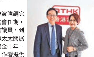
陳健波強調完成立法會任期，不再當議員，到時會和太太開展人生黃金十年。

波哥強調完成此立法會任期，不再當議員，到時66歲和太太開展人生黃金十年。到時我相信很多市民都捨不得他貼地的發言和金句，例如「好人有好報」等等，雖然他自謙老生常談，但我很同意，只要改變到一個人的心態，加起來便可改變整個世界，波哥金句影響深遠。