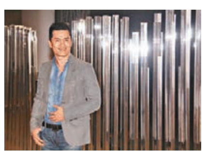
呂良偉很欣賞習近平主席做事作風，因他做的一切都是以人民幸福為依歸。

大家都清楚任何制度也有其優點與弱點，主要是執行者如何善用其最大的優點。現時西方的那套民主制度，資本主義社會的弱點也在浮現，正好是選「共產黨」及「中國特色的社會主義」一個公道的時候。難怪習主席說，未來要講好中國故事。也歡迎西方記者親自來中國看看，不需要他們美言，只需客觀報道。更引用元代王冕《墨梅》的詩句「不要人誇顏色好，只留清氣滿乾坤」表明內心的意志、自信！堅定走中國特色社會主義道路，不理別人說三道四，用成就來塞住別人的口。