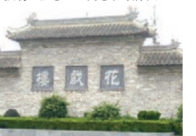
花戲樓，原名大關帝廟，位於亳州市城北隅成寧街。

牌坊上的磚雕，大多採用組合型磚雕，刀法細膩，構圖新穎。淺浮雕、高浮雕、透雕、鏤空雕和線刻等雕刻手法交替運用，考慮佈局、位置、比例、大小等關係，還有對稱、呼應、疏密、虛實、明暗、剛柔等對比手法，力求主次、遠近分明，強調立體感、空間感和韻律美。