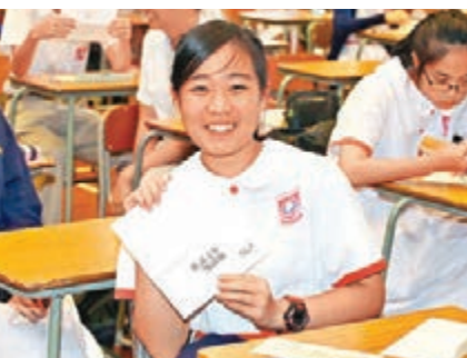
除現金支票外,同學們更收到印有李嘉誠簽名的鼓勵卡。

為評估「善用錢」成效,李嘉誠基金會委託獨立研究機構在今年7月下旬至8月向參與第一期計劃的51間學校及5,711名學生進行問卷調查,結果收回1,294份有效問卷,當中逾88%學生把5,000元投放作家用及補習,認為這筆款項對他們起了實際幫助;超過73%學生認為計劃增加了他們的快樂感受,有助