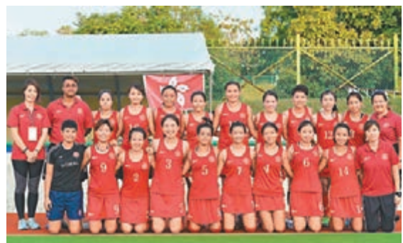
■ 香港隊在賽後合影留念。

2017亞洲女子曲棍球挑戰賽日前在汶萊斯里巴加灣市迎來決賽，繼在雙循環比賽中連勝4場闖進決賽後，中國香港隊不負眾望，4:0擊敗巴基斯坦奪得冠軍。