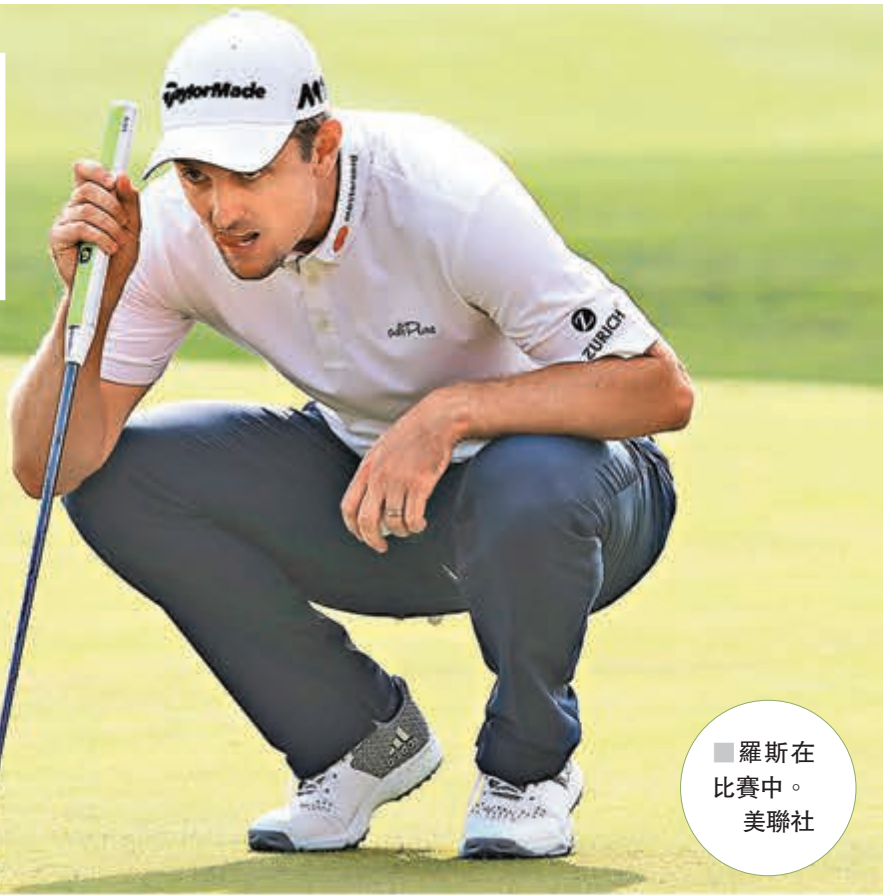
■ 羅斯在比賽中。

香港文匯報訊（記者夏微、章蘿蘭上海報道）昨日舉行的匯豐冠軍高球賽決賽輪，當所有人都以為一個德斯汀莊臣會憑借創紀錄的6桿優勢穩穩拿下他第六個世錦賽冠軍時，英格蘭人羅斯以黑馬姿態，在余山上演了驚天逆轉，以總成績274桿，低於標準桿14桿奪冠。