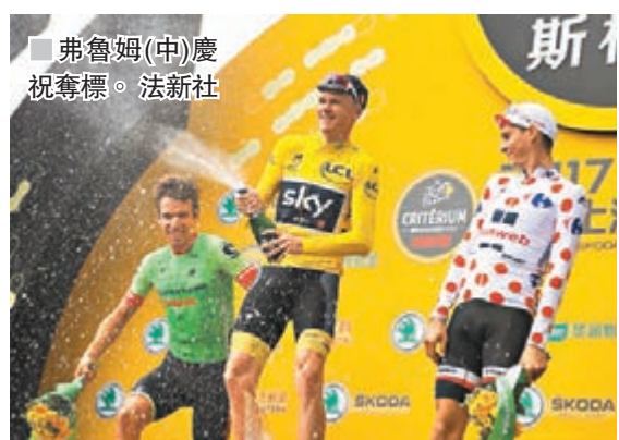
■ 弗魯姆(中)慶祝奪標。

香港文匯報訊（記者倪夢環上海報道）2017斯柯達環法上海巔峰賽昨日在滬正式上演，來自天空車隊的弗魯姆以1小時21分56秒的成績力壓群雄，獲得職業繞圈賽總冠軍。同時，中國選手發揮主場優勢，來自中國香港隊的蔡曉峰與來自雲南綠山園林洲際單車隊的孟俊濤均進入前十，中國香港隊還憑借精彩表現獲得了「最佳中國車隊」稱號。