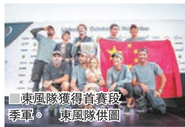
■ 東風隊獲得首賽段季軍。

香港文匯報訊（記者俞鯤報道）昨日，代表中國參加沃爾沃環球帆船賽的東風隊以第三名抵達了終點站里斯本，成功登上了第一賽段的季軍領獎台。下月3日沃爾沃環球帆船賽的七支船隊將在里斯本進行港內賽，下月5日所有船隊將再度起航，開啟從里斯本到開普敦的第二賽段比賽。預計賽事將在明年1月中旬抵達中國香港。