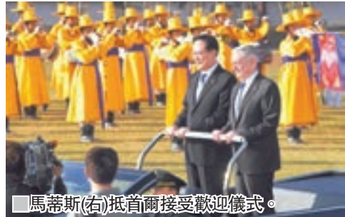
馬蒂斯(右)抵首爾接受歡迎儀式。