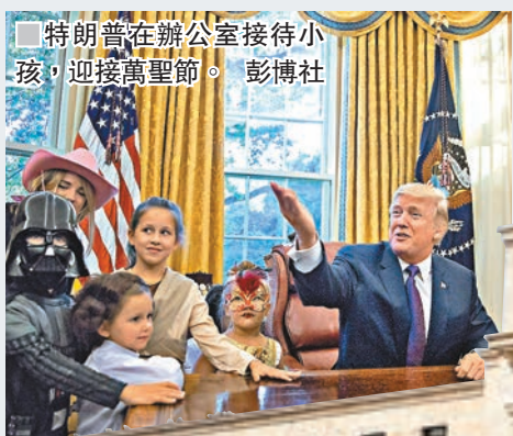
特朗普在辦公室接待小孩，迎接萬聖節。