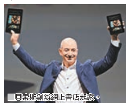
貝索斯創辦網上書店起家。