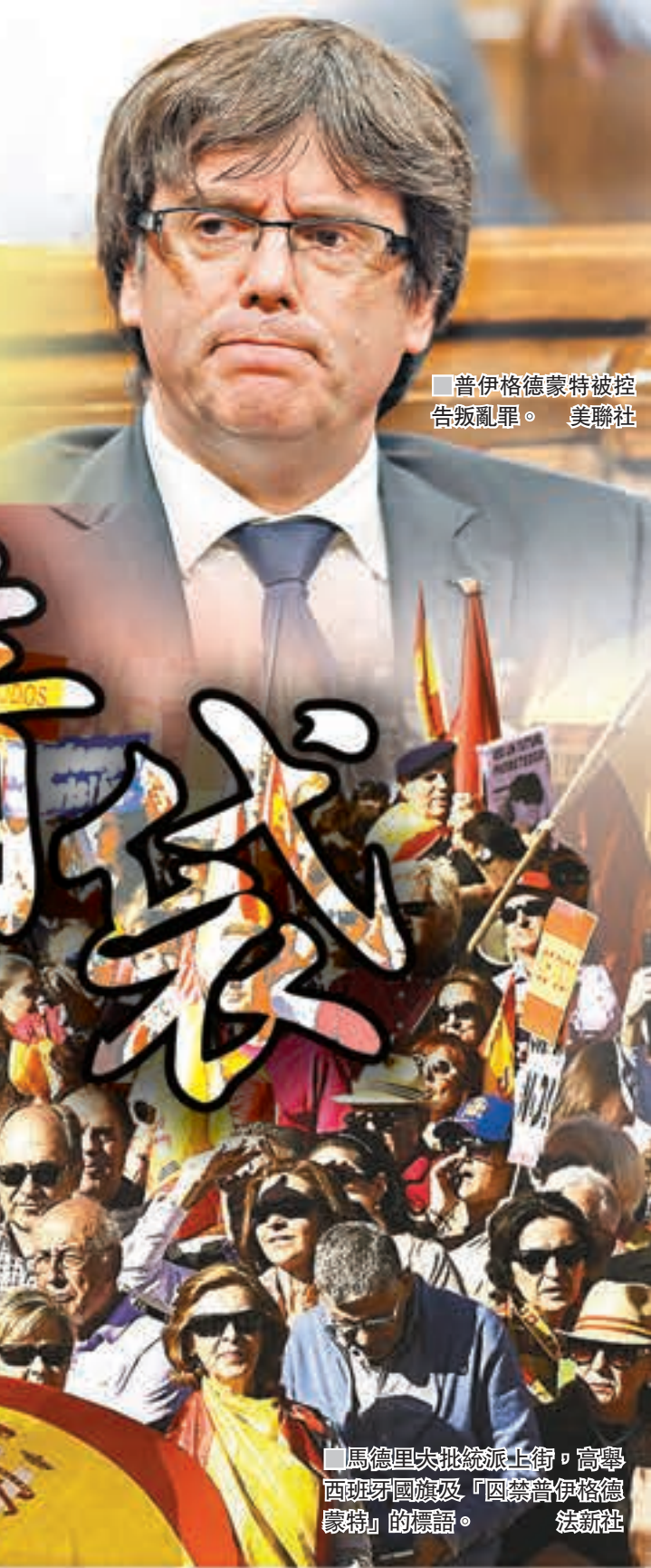
普伊格德蒙特被控告叛亂罪。

加泰羅尼亞議會前日單方面宣佈獨立後，西班牙參議院隨即通過決議，授權中央政府接管加泰。首相拉霍伊前晚發表電視講話，宣佈一系列反制措施，包括解除加泰自治區主席普伊格德蒙特的職務，以及撤換加泰警察總長特拉佩羅，並解散自治區議會，於12月21日進行重選。西班牙副首相薩恩斯將負責掌管加泰，直至舉行議會重選。