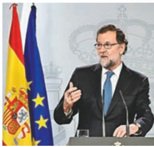
拉霍伊宣佈一系列反制措施。

加泰羅尼亞議會前日單方面宣佈獨立後，西班牙參議院隨即通過決議，授權中央政府接管加泰。首相拉霍伊前晚發表電視講話，宣佈一系列反制措施，包括解除加泰自治區主席普伊格德蒙特的職務，以及撤換加泰警察總長特拉佩羅，並解散自治區議會，於12月21日進行重選。西班牙副首相薩恩斯將負責掌管加泰，直至舉行議會重選。