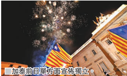
加泰前日單方面宣佈獨立。

西班牙加泰羅尼亞自治區前日宣佈獨立，中央政府隨即通過收回自治權，市場擔心這個歐元區第四大經濟體的政治危機持續，將拖累歐元區經濟，投資者紛紛拋售歐元，兌美元前日一度跌至1.1595美元，一周累計下挫1.6%，錄得今年以來最大單周跌幅。歐元兌日圓前日也一度觸及131.98日圓