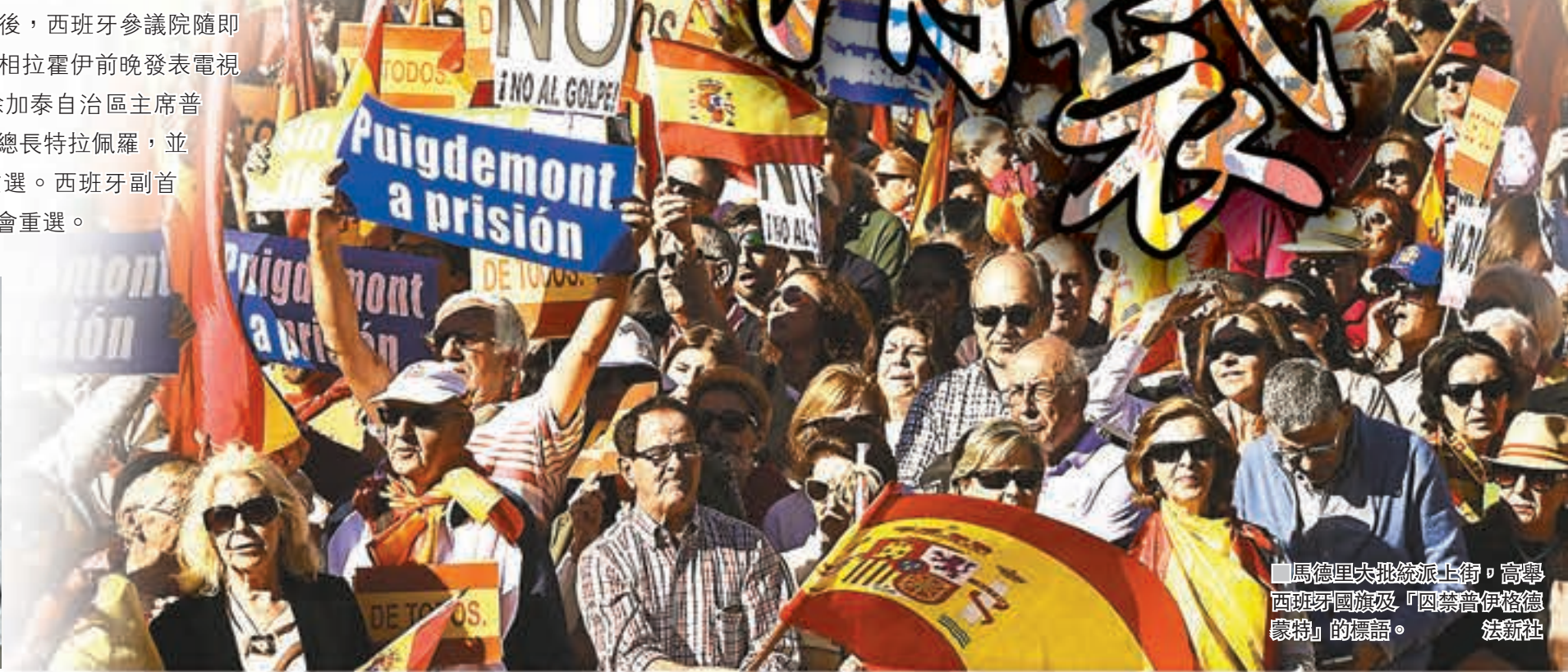
馬德里大批統派上街，高舉西班牙國旗及「囚禁普伊格德蒙特」的標語。

拉霍伊同時宣佈，關閉自治政府海外辦事處，並解除加泰駐馬德里及布魯塞爾代表的職務。他在電視講話中表示，接管自治區目的是「盡快將其回復正常、合法」，避免「不服從情況升級」。薩恩斯昨日與多位國務秘書會面，協調如何分配加泰各政府部門的職務，並會委任官員，落實馬德里的命令。