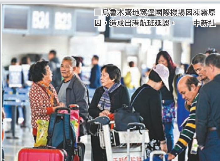
烏魯木齊地窩堡國際機場因凍霧原因，造成出港航班延誤。中新社

新疆烏魯木齊市城北區域昨日出現大霧天氣，部分區域能見度曾低至百米以內，樓宇與樹木隱沒在濃重的霧氣之中。由於能見度較低，道路上車輛行駛緩慢，並造成多起刮擦事故。中新社