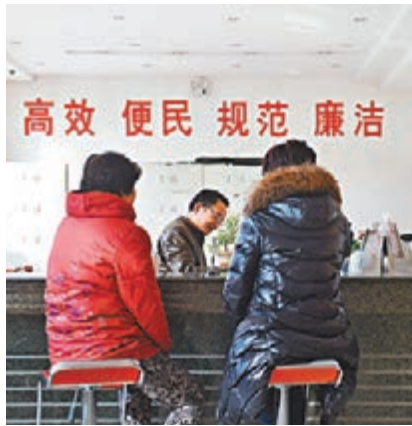
寧夏固原辦公用房騰退後服務民生。圖為市民在固原市原州區政務服務中心辦理業務。資料圖片

准建設辦公用房、辦公用房項目建設資金來源不符合規定等違法建設行為的，根據具體情況責令停止相關建設活動或者改正，對所涉樓堂館所予以收繳、拍賣或者責令限期騰退，對負責責任的領導人員和直接責任人員依法給予處分。《條例》還對建設樓堂館所的信息公開、監督檢查等作了相關規定。 在嚴格限制和規範機關、人民團體建設樓堂館所的同時，《條例》明確，財政給予經費保障的事業單位和人民團體以外的其他團體建設樓堂館所，參照適用此條例。