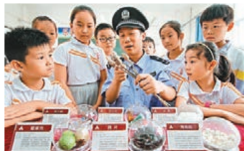
河北省邯鄲市磁縣公安局民警在磁縣崇文學校向學生講解毒品的危害。資料圖片

香港文匯報訊 據中新社報道，中國外交部發言人耿爽昨日在例行記者會上表示，中美禁毒合作會議將於10月30日、31日在北京舉行，雙方將對禁毒領域深化合作項目進行研究。 據報道，美國總統特朗普26日稱，將在與習近平主席會晤時作為頭等優先事項提及芬太尼(是一種強效、類似嗎啡的止痛劑)問題，美將與中國等國家合作應對該問題。美國國務院官員稱，國務院和司法部下周將派團訪華，舉行反毒品工作組會議，進一步擴展與中方打擊非法藥物合作。