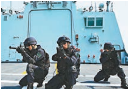
執行護航任務的第二十五批護航編隊特戰分隊結合亞丁灣、索馬里海域海盜活動的最新情況和特點，今年初在護航線上積極開展訓練。資料圖片

易航道安全。 「中方參與打擊索馬里海盜國際合作的行動，得到了有關國家的積極評價，為維護國際和地區的和平與安全作出重要貢獻，也展現了中國負責任、有擔當的大國形象。」耿爽說。 他說，聯合國秘書長的有關報告對中方所作工作和貢獻給予了積極評價，中方對此表示讚賞。 耿爽說，正如習近平總書記在中共十九大報告中所指出的，中國將恪守維護世界和平、促進共同發展的外交政策宗旨，始終做世界和平的建設者、全球發展的貢獻者、國際秩序的維護者。中方將繼續積極參與亞丁灣和索馬里海域護航行動，拓展國際護航合作，履行國際