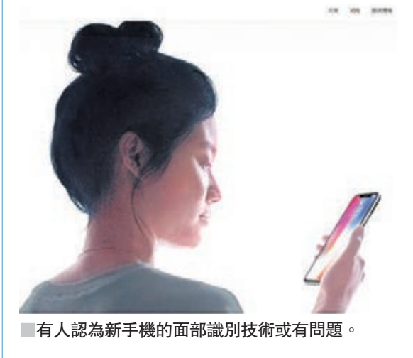
有人認為新手機的面部識別技術或有問題。

iPhone X瞬間於15分鐘內預售罄,可謂「一機難求」。其實於預售前後都有不少網民在網上討論今次炒風,有人認為今次炒得很貴,貼近2萬元至3萬元一部手機,但有人認為新手機的面部識別技術或有問題,有機會取到手機後要更換手機,得不償失。亦有人打算透過電訊公司的手機月費計劃出機,形容是「多條後路」。 昨日下午瞬間完結iPhone X「搶掠戰」後,有網民以「留名等睇iPhone X炒家一手蟹貨」於討論區上發帖,引發不少網民留言。網民「Patrickbee」表示,預訂程序本已到達結賬的位置,但再按F5更新鍵後,畫面已彈至「我們目前不接受預約購買iPhone的畫面」,形容很無奈。網民「chanwing-wa77」表示,打算透過電訊公司的手機月費計劃出機。 有網民不認為跟風買機是好事,「re-ni520」說:「七都追,同狗仔追巴士有七分別,最緊要係啱自己用。」「芒果野人」認為,iPhone X少貨,一來會炒得很貴,二來擔心手機會否有問題,要更換。「黑人炸雞」表示,現時有市場人士估計,iPhone X今年出貨量僅2,000萬部,數量僅是預期的一半,相信是支援面部識別新功能的零件出現技術問題,或因產量少而炒得貴。