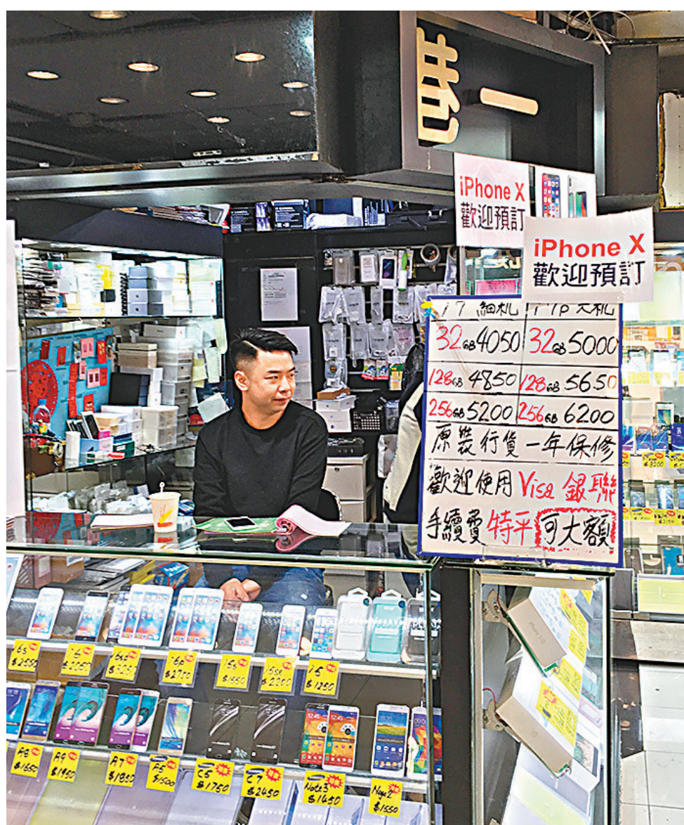
先達廣場多間店舖掛出「高價收購iPhone X」的告示。