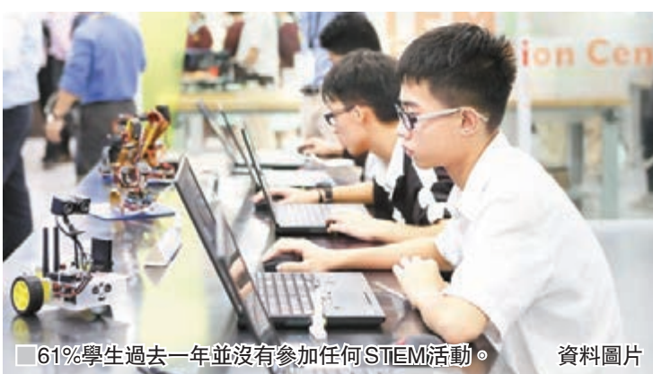
61%學生過去一年並沒有參加任何STEM活動。

是次研究除搜集STEM活動資料外,亦訪問92名小學生、335名中學生和200名家長。 當中61%學生過去一年並沒有參加任何STEM活動,原因為沒有時間、沒有興趣和對STEM科目沒信心;而家長則認為語文活動最為重要,STEM只是次選。 裘槎基金會董事、浸會大學校長錢大康指,STEM有助訓練學生解難能力和邏輯思維,對在不同行業發展皆有幫助,絕非只針對培育科技人才。